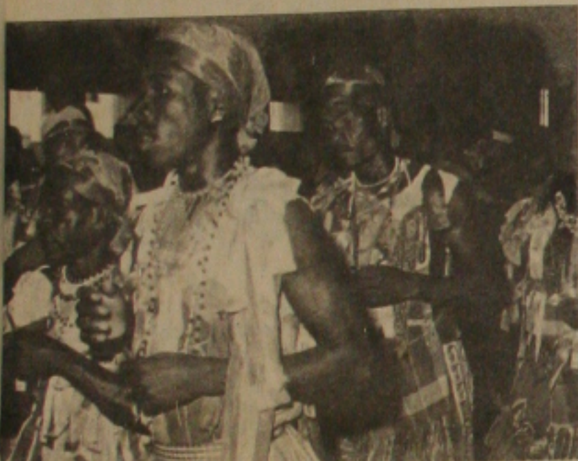
... hoje e amanhã é voltado cidade de Laranjeiras. Lá está acontecendo mais um Encontro Cultural. Vale conferir.

do prosseguimentos ao prolo XI Encontro Cultural de ras, logo mais às 09 horas