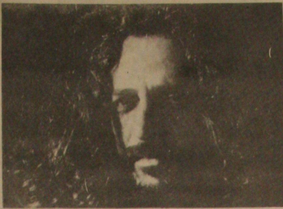
Alceu Valença é a grande atração deste início de semana em Aracaju. Ele se apresenta terça-feira, às 21 horas, com o show "Estação da Luz", no Ginásio de Esportes Cons-tâncio Vieira.