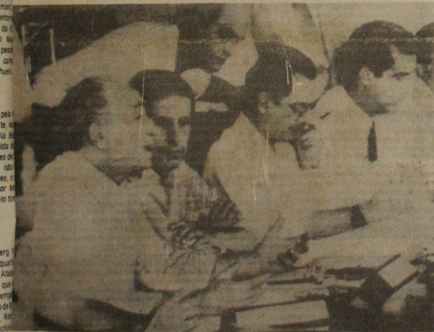
Os ministros Costa Couto, Pedro Simon e Dilson Funaro ouvem exposição do Governador Franco Montoro.

A agilização já a partir da próxima segunda-feira (6) das normas do pró-agro, de modo a permitir um rápido ressarcimento dos prejuízos sofridos pelos agricultores com a estiagem e adoção de medidas em conjunto com a Federação Brasileira dos Bancos (FEBRABAN) para que sejam sustados os processos de recursos financeiros em razão dos prejuízos sofridos em suas lantações.