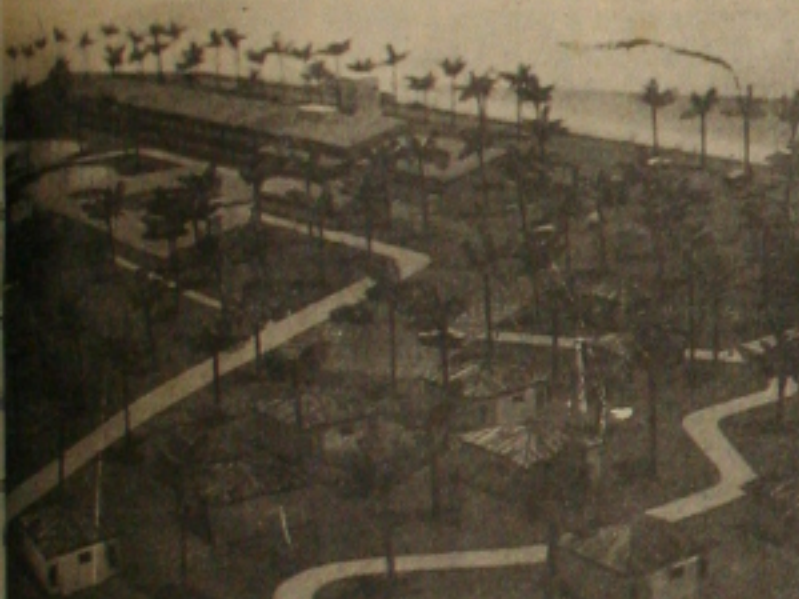
um dos melhores Hotéis do Nor- deste. Ele será inaugurado dentro de mais dois meses

* Para tentar reconquistar Porci- na, Sinhozinho Malta, - que não vai desistir tão cedo, de tão cabeça dura, que é - vai cobrir Matilde de presentes caríssimos. E não é mesmo que Porcina vai se abalar? Quando ela ver o carro de luxo as jotas, e finalmente um anel de bri- lhantes no valor de 50 milhões de cruzeiros, vai ficar enfurecida, a ponto de provocar ciúmes em Roque.