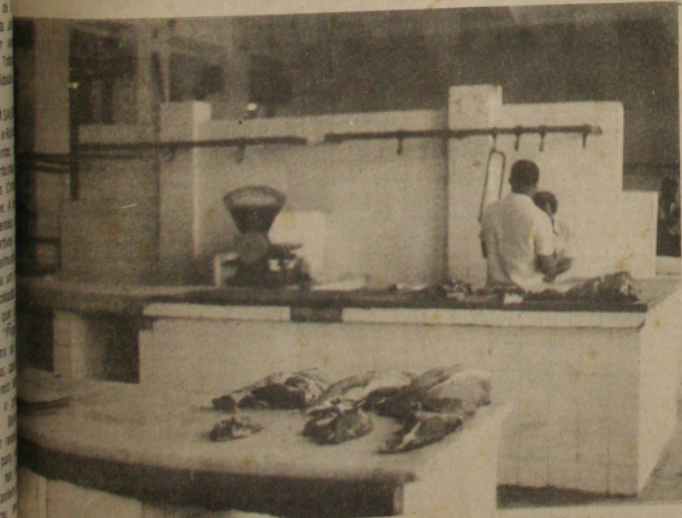
carne faltou e somente os comerciantes que receberam o produto da Nutrial tiveram acesso.

Apesar dos abatedores reivindicarem uma maior rigidez da Inspeção Federal do Ministério da Agricultura, segundo informações fornecidas por elementos envolvidos no movimento grevista, não foi possível a conquista, pois as autoridades consultadas disseram ser necessária para evitar complicações para a saúde da população. Os abatedores, segundo a mesma fonte, continuaram com a reivindicação em pauta e esperam viabilizá-la ainda neste semestre. (notícias locais nas páginas 02 e 04)