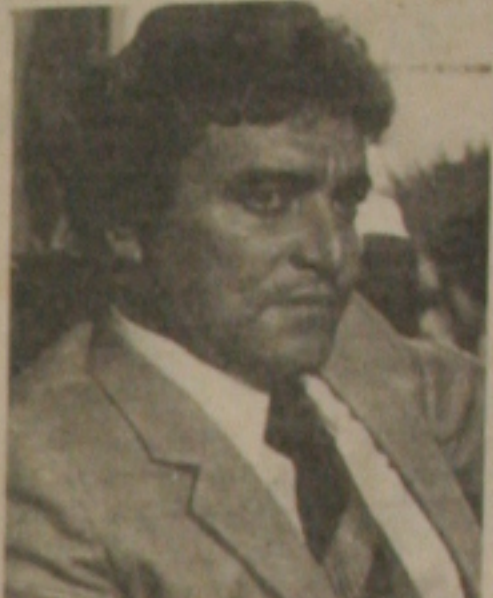
Acival explica adiantamento dos DIAs

O grande Distrito Industrial de Sergipe será o da cidade de Socorro. Para a unidade industrial maior importância para o desenvolvimento do Governador Acival Gomes Filho que, para sua implantação, começou com a aquisição de área de terra em torno de 137 hectares para a ocupação com grande conjunto residencial, construção de suas primeiras estruturas, apresentando o terreno como fator de apoio ao projeto. O restante da área, será efetivamente utilizado para instalação de indústrias.