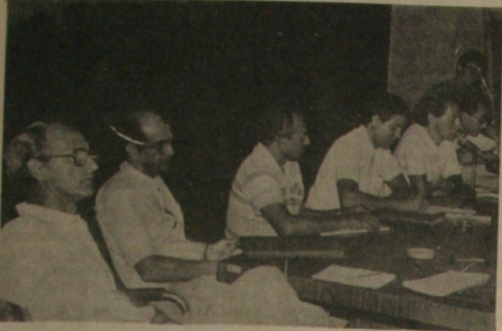
A palestra de Carlos Minc foi seguida de debate com a participação do auditório.

Promovida pela Universidade Federal de Sergipe, através da Pró-Reitoria de Extensão e Assuntos Comunitários e Centro de Atividades de Extensão e o Núcleo de Pós-Graduação em Geografia, foi realizada ontem (sexta-feira), no auditório da Reitoria, uma mesa redonda sobre "Reforma Agrária: Instituto Para Transformação da Realidade Agrária no Brasil". O palestrante foi o professor Carlos Minc, da Universidade Federal do Rio de Janeiro.