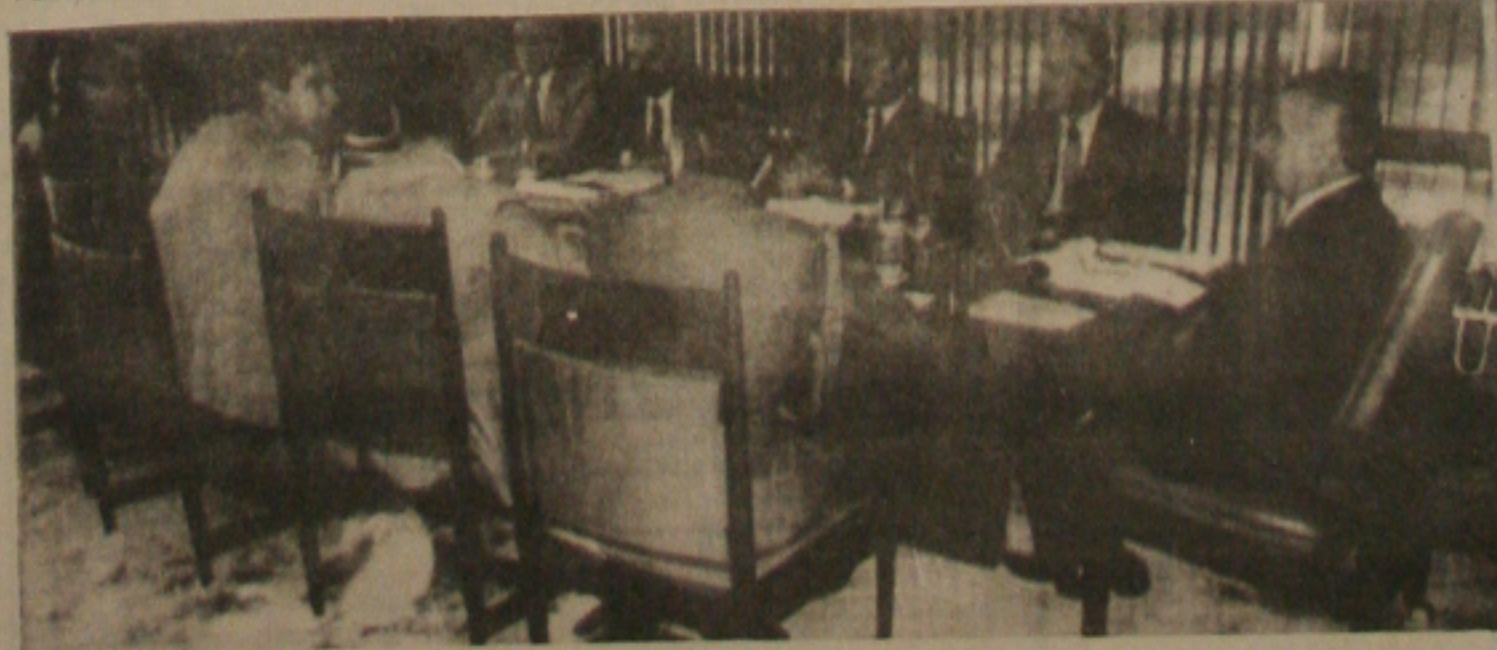
O Presidente José Sarney reuniu-se com ministros da casa, do Planejamento, Fazenda e Interior e