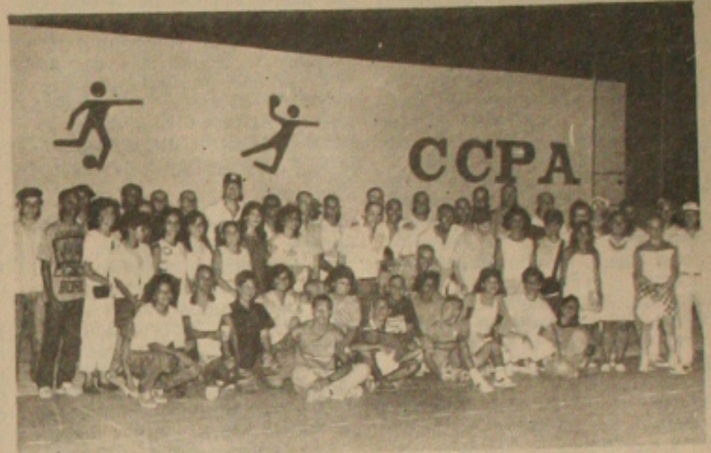
Parte dos aprovados, no pátio do Colégio na festa da vitória após o resultado do Vestibular.