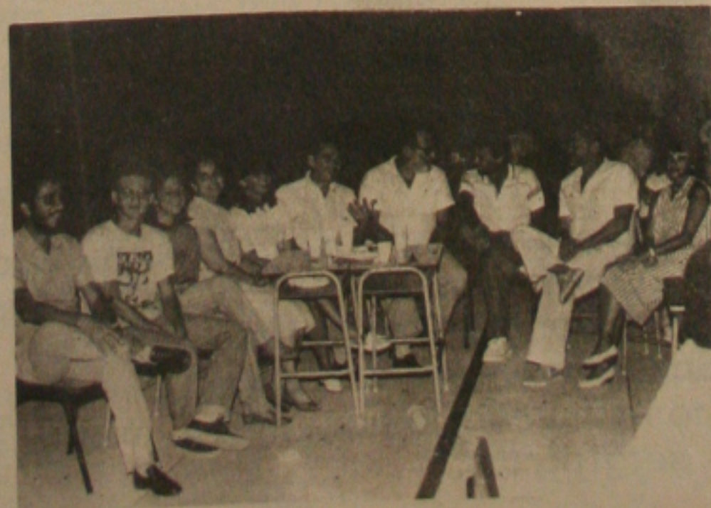
A presença dos pais e Professores na festa da Vitória.