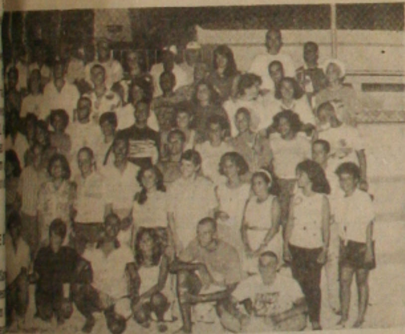
Tri-Campeões na quadra de tênis do Colégio.