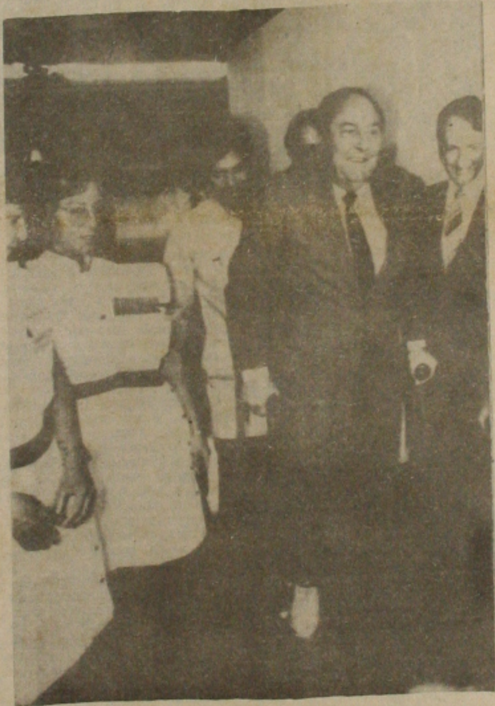
De muletas, o ministro Aureliano deixa o Hospital Sara Kubitschek após entrevista a imprensa.

Quanto à posição do PFL na próxima constituinte ele explicou que as posições liberais sempre foram "posições de mudança e que o liberalismo moderado é progressista, voltado para as realidades sociais, cada vez mais prestes no mundo", disse que o liberalismo busca "o equilíbrio entre a iniciativa privada, sentimento matriz do pensamento liberal na área econômica, mas não exclusivista". Acrescentou que "nos não nos alinhamos entre aqueles que postulam esta alternativa ou iniciativa privada ou iniciativa pública. Nos compreendemos, que no mundo atual o estado tem que se fazer presente na economia, apenas limitá-la por legislação clara e definida".