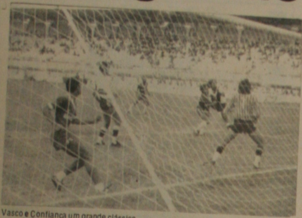
Vasco e Confiança um grande clássico

Vasco e Confiança fazem esta tarde o primeiro grande clássico do certame de 86. É uma partida que promete agradar, pois ambas as equipes se prepararam com muita motivação para o certame deste ano seguindo à orientação da CBF de que o campeão de 86, representará o Estado no campeonato nacional de 86 e 87. O Confiança por sua vez fez um novo time. Está motivado, venceu a primeira partida e espera hoje a tarde conseguir a primeira grande vitória, mostrando que o time está mesmo preparado para a conquista do título.