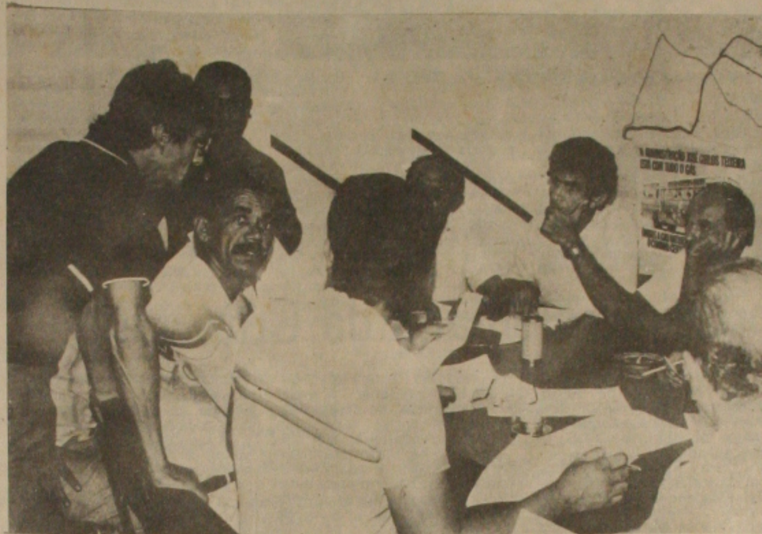
Reunião na SETUR para definir nova tarifa dos táxis.