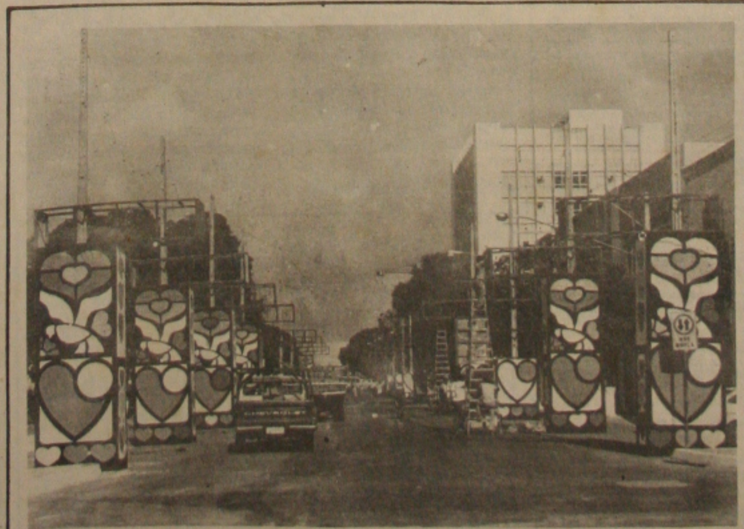
Faltam apenas os relíquias para a conclusão das obras de instalação do Clube do Povo,

Por isso, eles resolveram desenvolver uma campanha de esclarecimento da opinião pública sobre as reformas promovidas no Banco pelo Conselho Monetário Nacional (CMN) e acumular forças para tentar uma greve, em março. O diretor de divulgação do Sindicato dos Bancários, Carlos Silveira, disse que o Governo está tentando fazer a reforma bancária, "no estilo da ditadura, aproveitando o recesso do legislativo" e comparou o Ministro Dilton Funaro ao ex-ministro Delfim Neto, acusando-o de concentrador de poderes e eminência parva do regime.