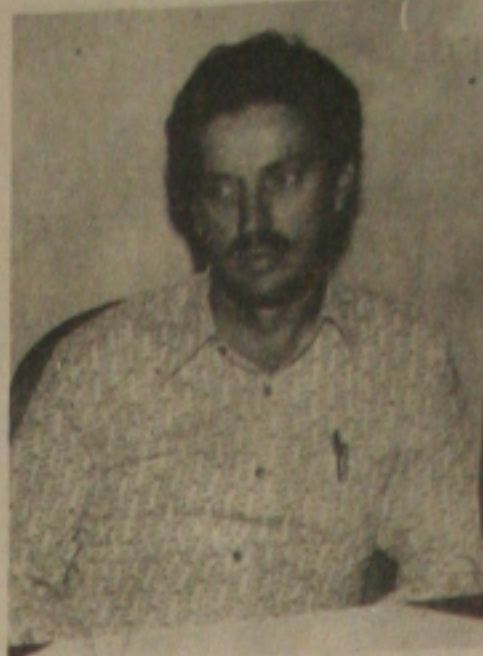
Garcez já definiu os plantões do Carnaval.

A partir de hoje a praia de Atalaia já conta com um policiamento ostensivo por ser véspera de carnaval, onde grande parte dos foliões inicia a festa.