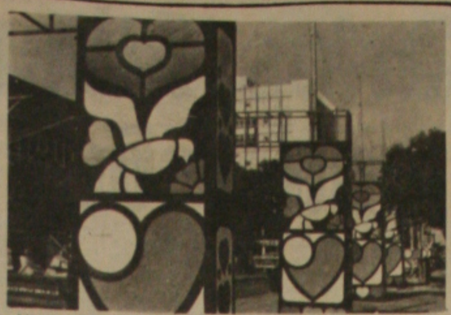
Até que enfim pintou a decoração pequeno trecho onde vai ser realizado o carnaval a partir de hoje.

* A adesão oportunista de políticos ligados à Velha República ao PMDB desgostou a cantora Fatá de Belém, que já se prepara para deixar o partido. Fatá pretende mudar-se de armas e bagagens para o PDT de Brasília.