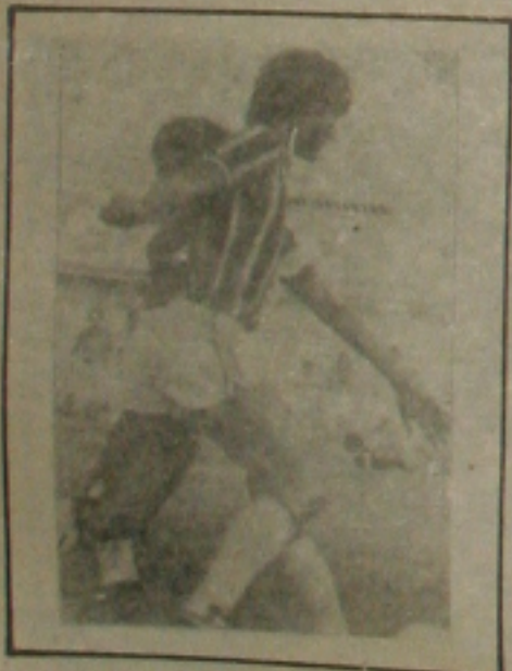
Angiolente uma das vítimas da violência do Olímpico.

Líder absoluto do campeonato com seis pontos ganhos em três