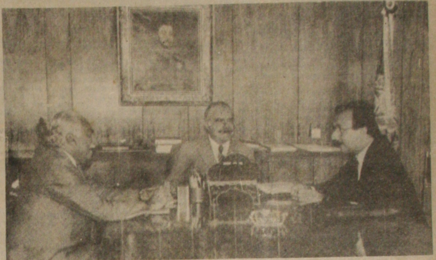
O Presidente José Sarney recebe em audiência o senador Lourival Batista e o Prefeito de Aracaju, Jackson Barreto.

Anunciou que vai realizar um censo para saber as reais necessidades do município em termos de funcionários e que os excedentes serão dispensados.