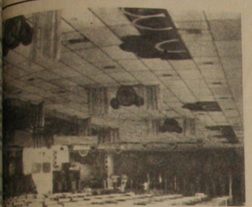
O Iate Clube de Aracaju não foi posar todas a sua decoração ontem, mas pela foto dar prá dizer que beleza vai ser de decoração.