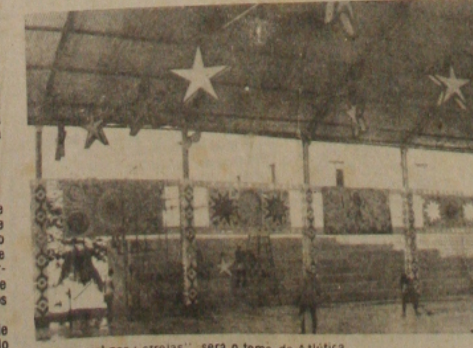
"Carnaval nas Estrelas", será o tema da Atlético.

o Clube do Povo abriu o Carnaval de 1986 para a população o "Clube do Povo" disse que uma administração verdadeiramente democrática deve deixar de atender os desejos e o carnaval, como festa, não é uma das prioridades da organização do Carnaval. O júri que vai escolher os blocos e Escolas de Samba será a Av. Barão de Maruim, na noite de 10 de fevereiro. Desfilarão na noite de 11 de fevereiro seis Escolas de Samba e seis blocos de acordo com o seguinte ordem de apresentação: Petróclube, Nem é isso, As Italianas, Skina, Os Havaianos da Ilha, Escola de Samba da Praia, Brasil Moreno, Escola do Morro, Amigos do Serrano e Batuqueiro. Após o desfile, o Trio do Clube do Povo irá para a praça encerrar a programação com um grande baile interativo, blocos e a população.