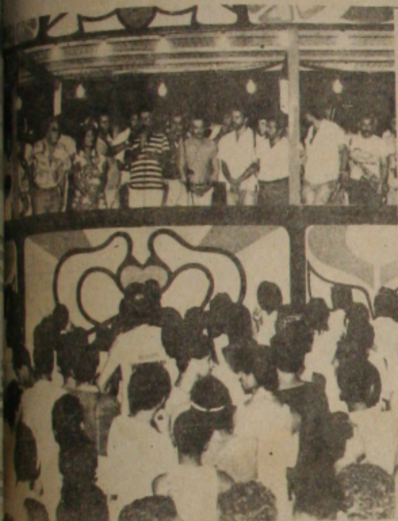
No Clube do Povo, o Prefeito abriu o Carnaval.