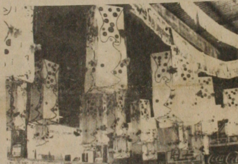
A "Paz", também é o tema do Cotinguiba.