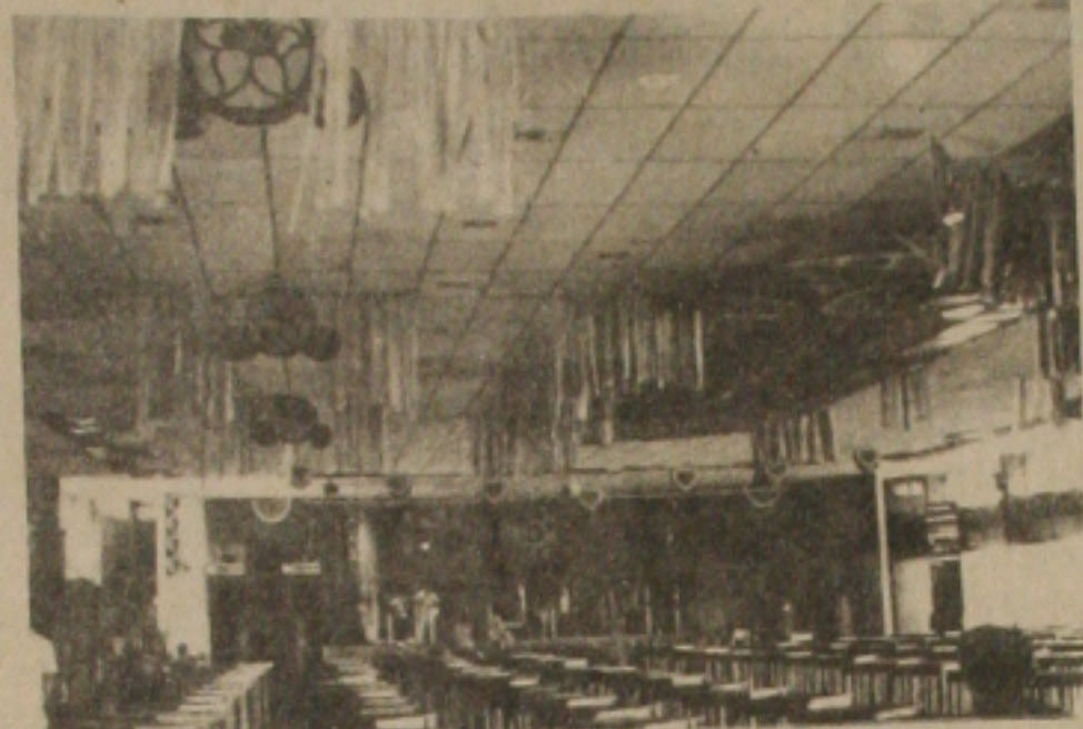
"Amor e Paz", é o tema da decoração do late Clube.