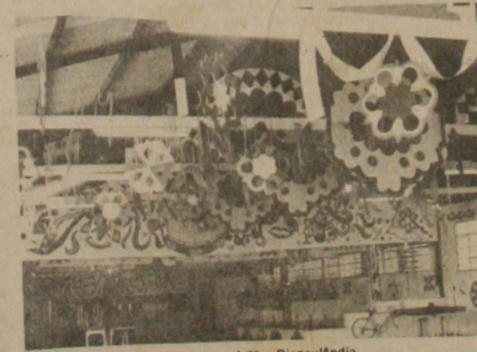
O Vasco, apresentará o "Carnaval na Disneylândia.