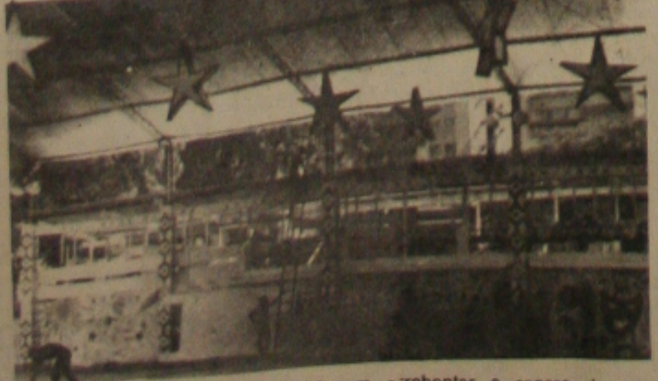
Associação Atlética de Sergipe foi o clube que investiu pensando em arrebentar o caneco da melhor decoração.

O Ano do Cometa Halley, a Associação Atlética de Sergipe clube de muitas glórias carnavalesca está com seu salão de festa decorado a espera de inúmeros associados. A decoração intitulada "O Carnaval nas Estrelas" promete ser uma das finalistas do concurso.