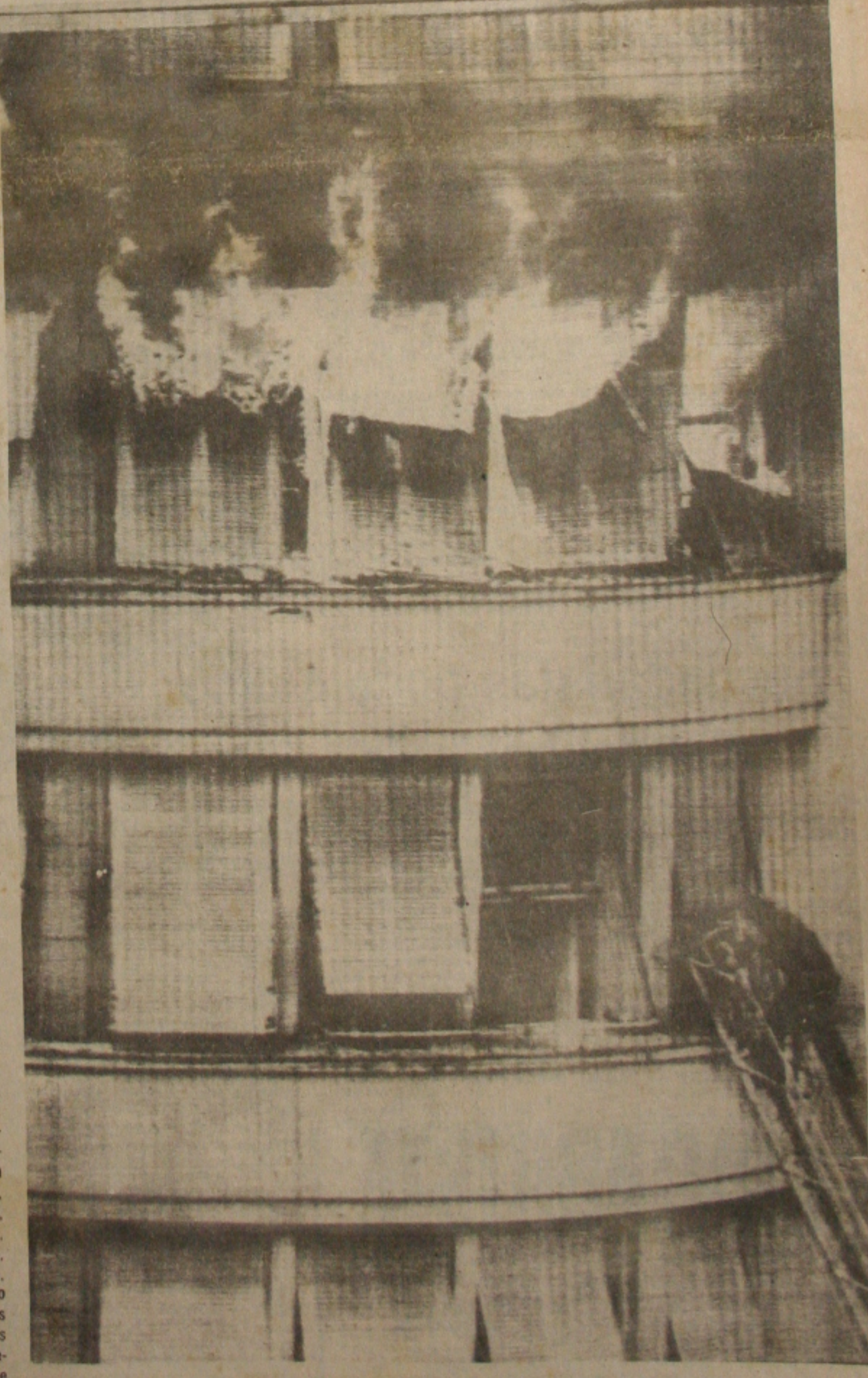
Bombeiros tenta resgatar vítimas do incêndio no Edifício Andorinha, no centro do Rio.