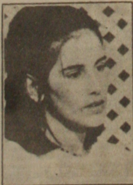
Atriz Glória Pires livrando-se das gordurinhas.

09:00hs - Jimmy Swaggart 09:30hs - Tv Educativa 09:50hs - E L A 10:00hs - L B V 10:10hs - Sociedade 10:30hs - Musical 10:45hs - Primeira edição 11:00hs - Esporte total 11:30hs - Esporte 08 12:00hs - Super special