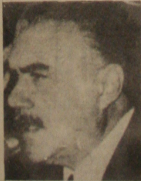
O Presidente Sarney virá a Sergipe.