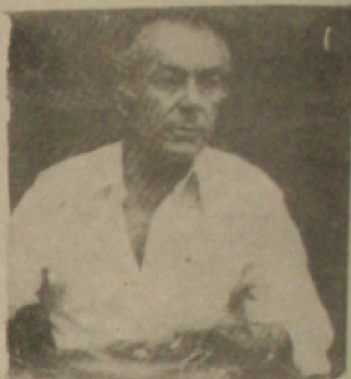
Sarney está sem sustentação: Brizola.

zola à pergunta sobre as novas medidas do Governo Federal, Brizola falou rapidamente para a imprensa, de dentro do Palácio do Planalto, depois de ter participado de uma cerimônia em homenagem aos Mortos da Guerra Mundial, no Flamengo. —Todos nós estamos do como se apresentando propõe o novo Ministério da Medida que verifica compromissos a que o Governo Sarney, não sumir nossas posições. Nós somos críticos ao novo Ministério-Governador. O senhor acredita medidas serão suficientes para combater a inflação? —o repórter. —Podemos até ter boas intenções, mas o País não fazer o seu dever para o seu povo, não instituir um Governo, nós estaremos, a rigor, dando tempo, finalizando