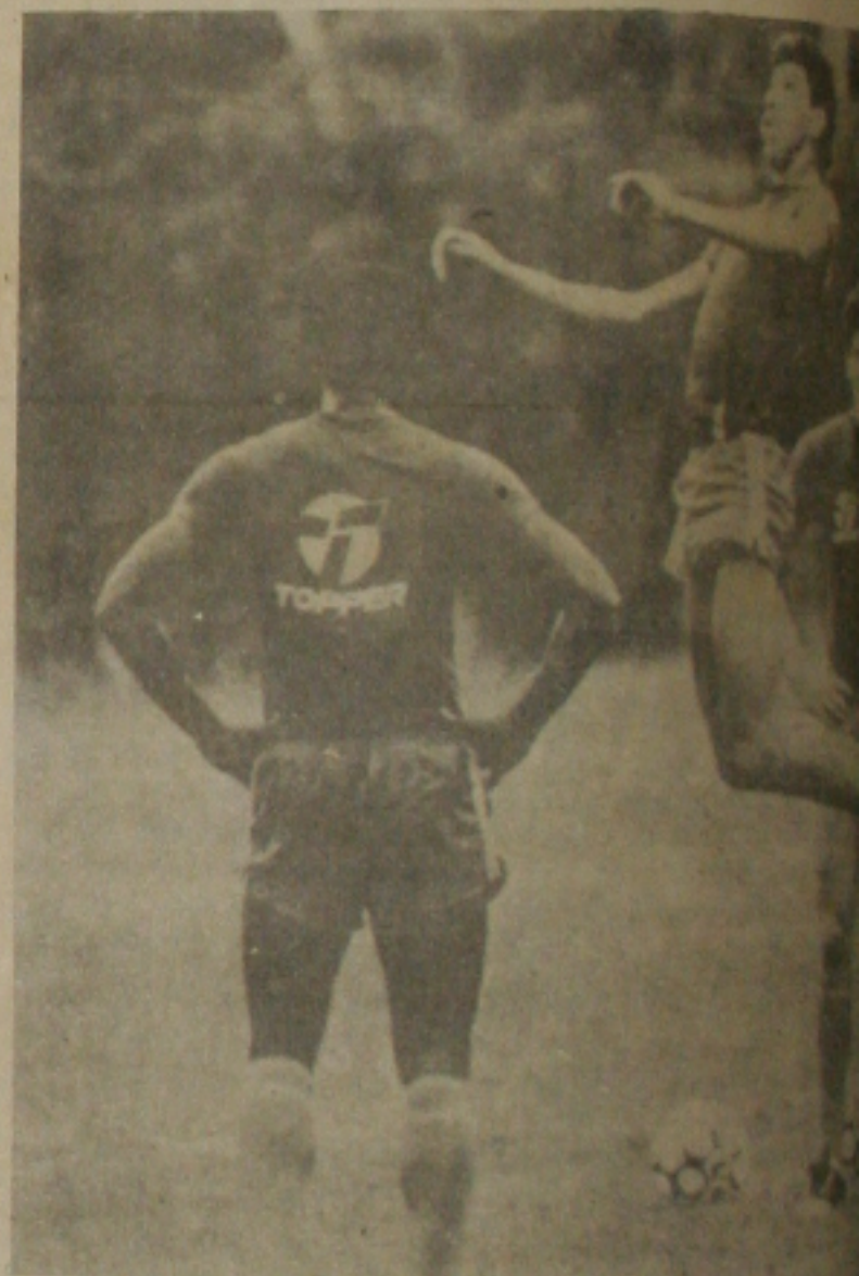
MOZER É O MELHOR NA IMPULSAO

Vamos ajudar ao I.B.D.F. a combater a caça; porque quanto mais MATA VOCÊ DERRUBAR, ANIMAIS, AVES e INSETOS VOCÊ MATAR, mais inseticida VOCÊ VAI GASTAR!