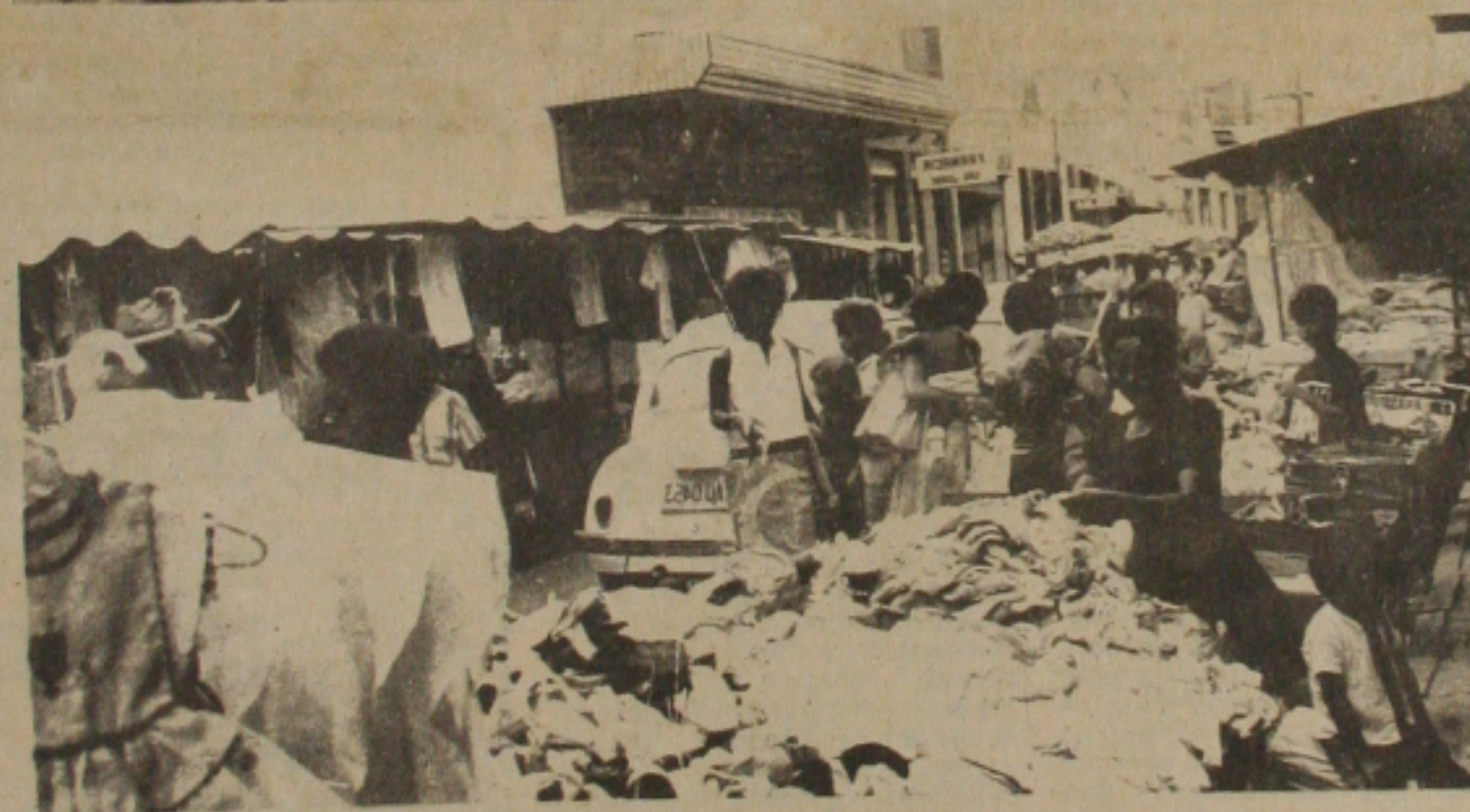
rios. O ato, apesar da ausência de uma confirmação oficial, foi revogado, mas os barraqueiros estão observando o comportamento político da atual administração. (Página 04)