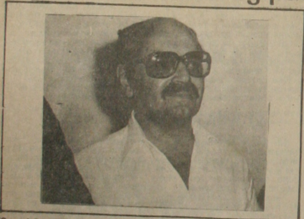
Conceição condena Nova República

A classe empresarial do Estado de Sergipe acredita que a decisão tomada pelo Conselho Monetário Nacional - CMN, através de contatos, por telefone, quinta-feira passada, estabelecendo normas para conter o consumo, repercutirá de maneira drástica no comércio de Aracaju.