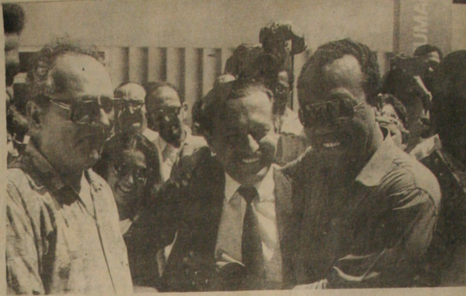
Valadares é recebido pelo governador João Alves no aeroporto.