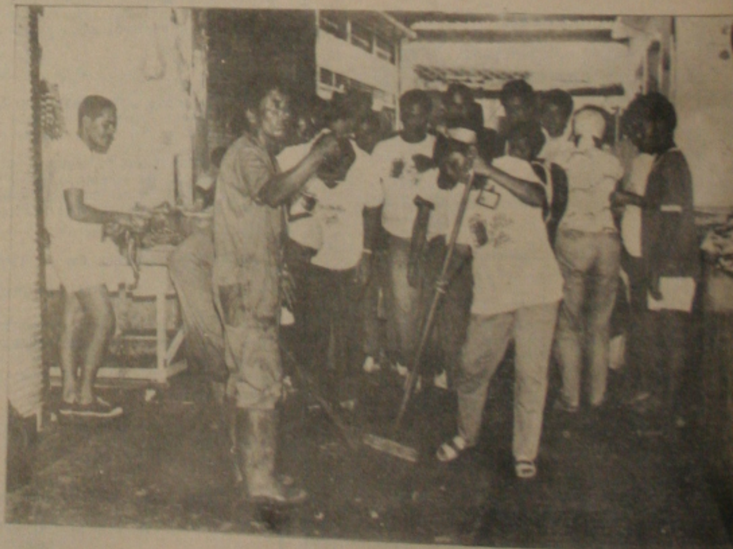
Secretário da Educação participou do Mutirão.

A chuva atrasou mas não impediu o primeiro grande Mutirão da Limpeza, ligando efetivamente as turbinas da Administração Jackson Barreto, para construir um Novo Tempo em Aracaju. Mercado para as 6h45min., foi às 7h30 que o Prefeito, Secretários municipais e equipes da Prefeitura iniciaram o trabalho, começando pelo Mercado Hortifrutigranjeiro, inaugurando um novo estilo de governo no Município, onde povo e poder públicos juntos se responsabilizam pela gerência da cidade.