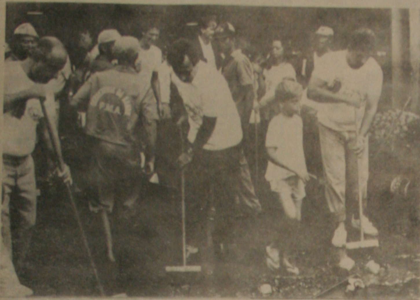
O prefeito e o vice também limpam o mercado.