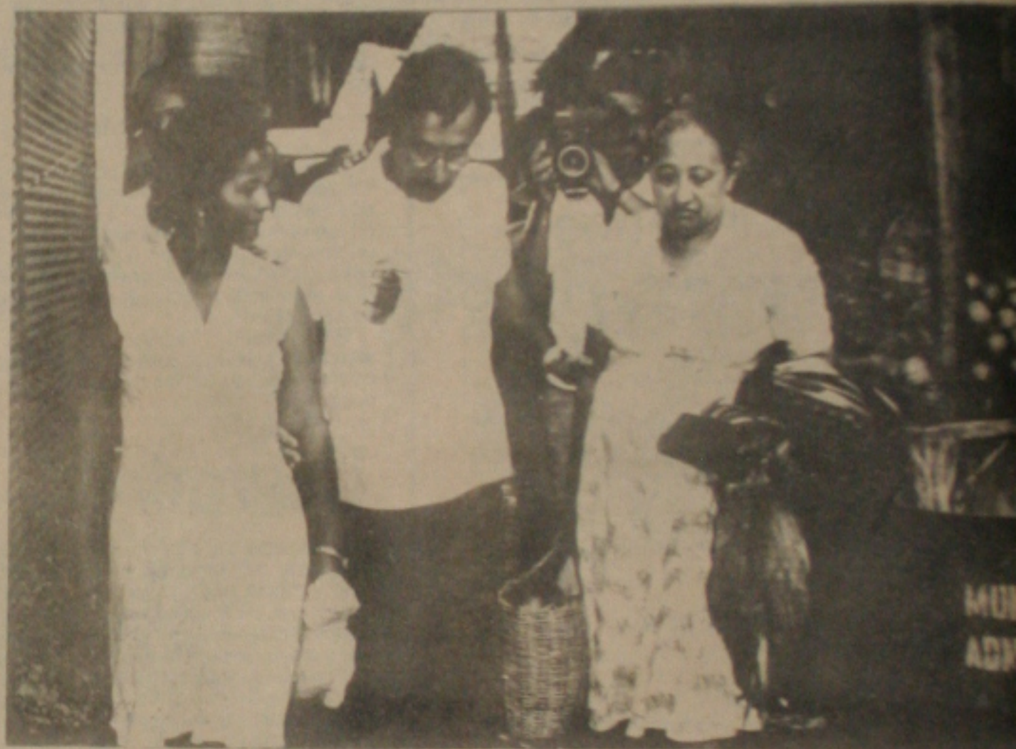
A informalidade do prefeito com uma consumidora do mercado.