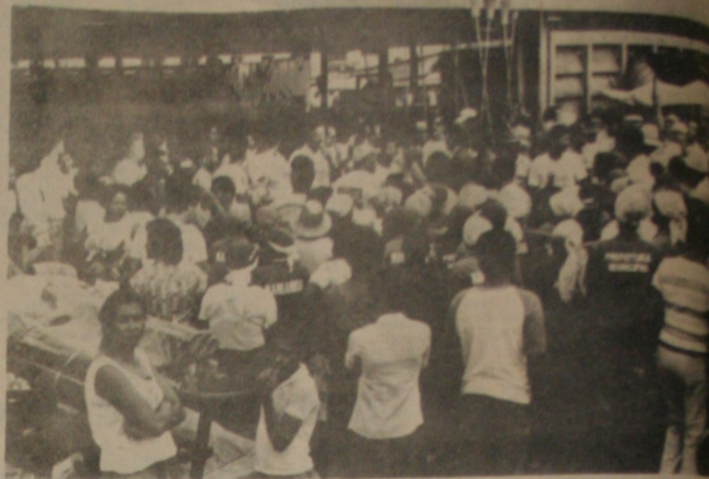
Funcionários e povo, juntos, no mutirão.