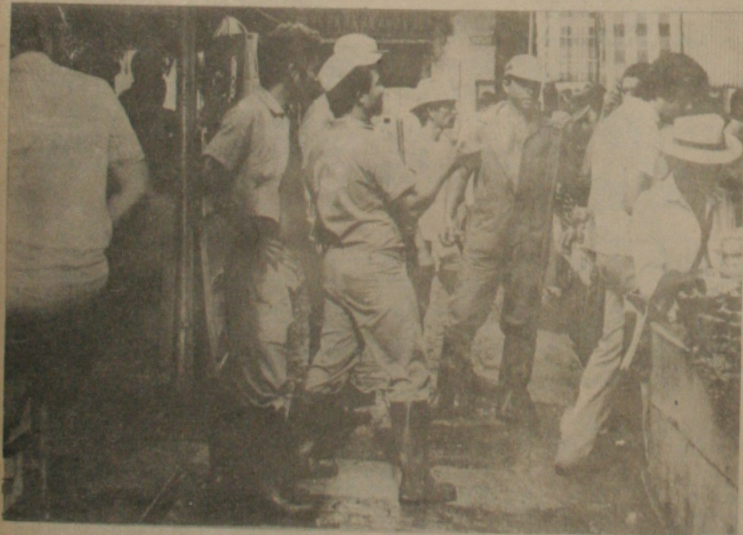
As "Bocas de Lobo", agora, estão limpas.