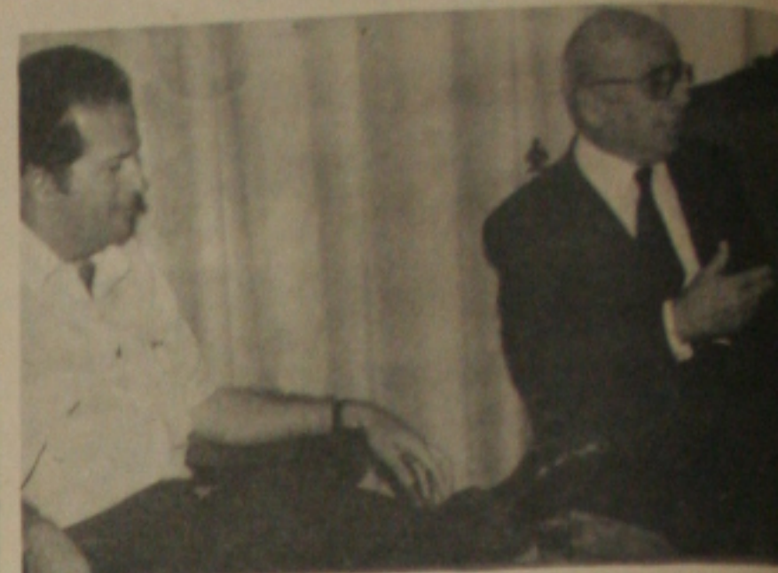
DJENAL QUEIRÓZ NO SESI

Comenta-se que ainda esta semana, o General Djenal Queiróz, estará assumindo a Superintendência do SESI em Sergipe. De ser um político que luta pelo Estado de Sergipe, o General Djenal de Queiróz, é considerado o patrono do futebol sergipano.