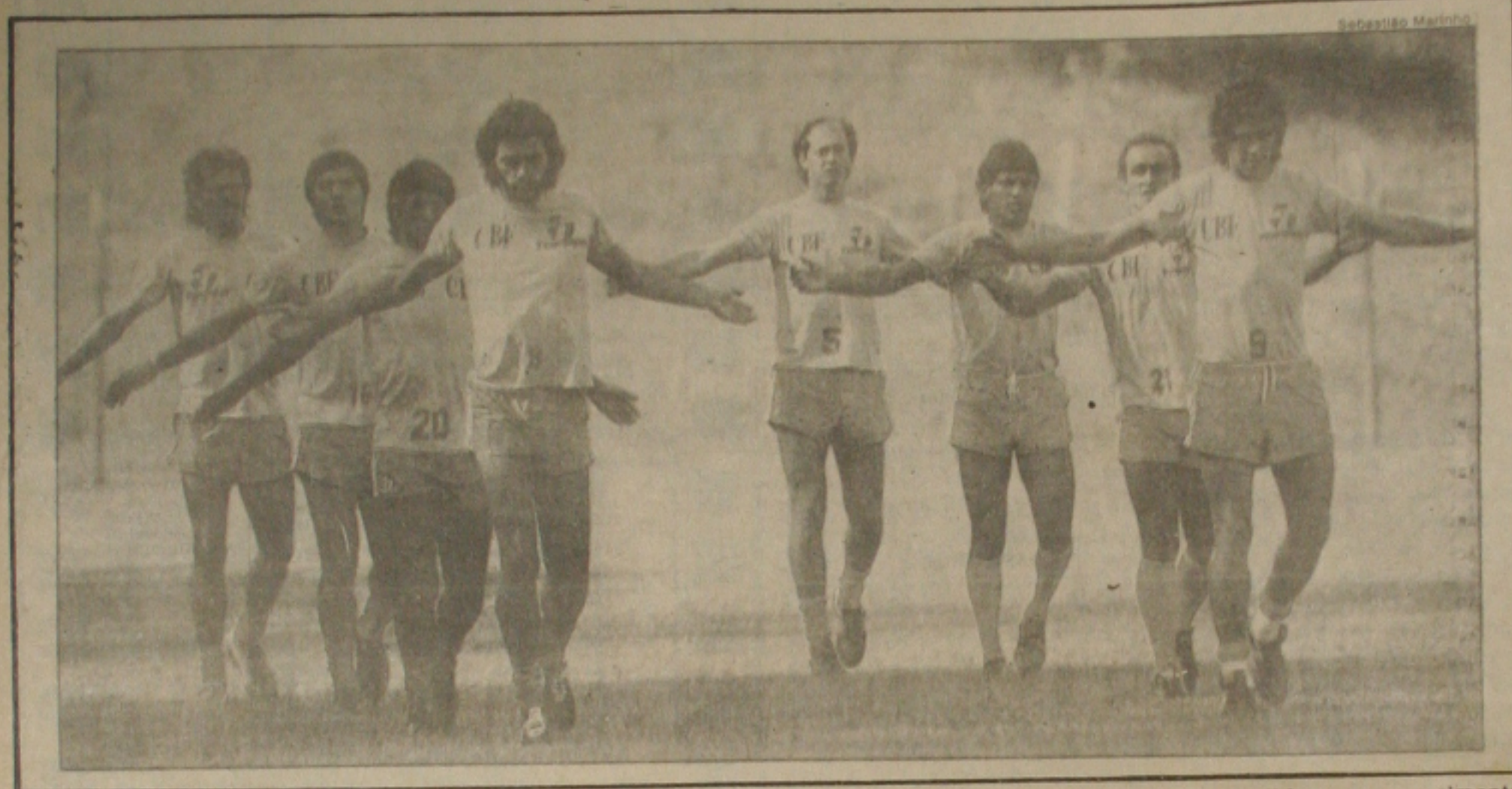
Na fria Frankfurt, o selecionado do Brasil faz o seu aquecimento.

O Selecionado Brasileiro faz esta tarde-noite em Frankfurt - o primeiro amistoso nessa fase de preparação para a Copa do Mundo, enfrentando o selecionado da Alemanha. Ontem apesar do frio, o treinador comandou um treino coletivo no Waldstadion local do jogo de logo mais e deixou a equipe definida. O time conforme o próprio Telê ainda está em fase de experiência e hoje o importante não é o resultado, mas sim a atuação da equipe e o treinador vai observar como atuarão os diversos setores da equipe.