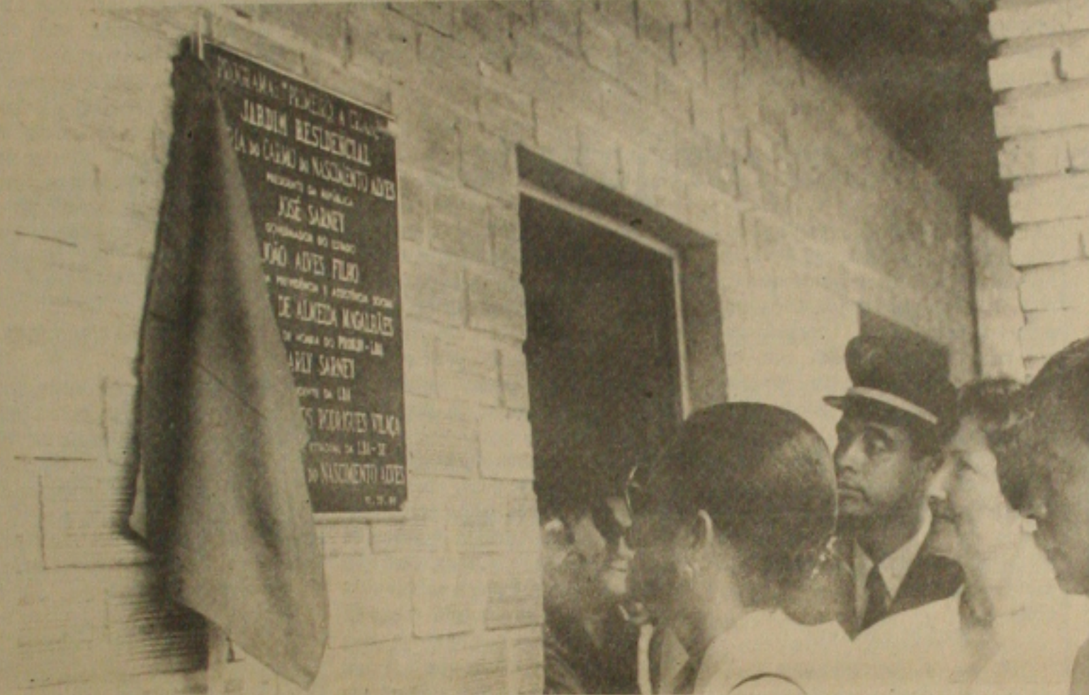
A Primeira Dama do País inaugura oficialmente o Jardim Residencial D. Maria do Carmo Nascimento Alves, núcleo do programa "Primeiro a Criança".