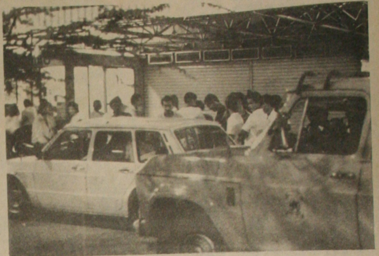
... e interditou o hipermercado por três dias.