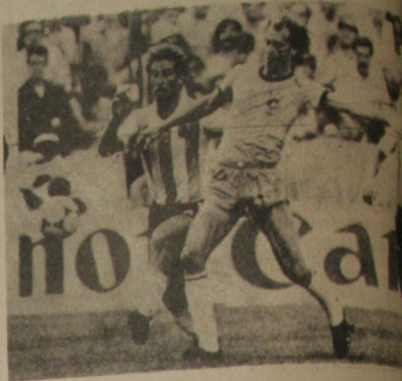
Falcão: falha no segundo gol.

Analisando a partida feita pelo time brasileiro conclui-se que muita coisa deve ser modificada no selecionado de Telê, alguns atletas deram a nítida impressão de que não podem ser titulares na Seleção Brasileira e outros tocam a bola em demasia sem nenhum proveito. Bom essa derrota venha a acontecer nessa fase de preparação, isso porque há muito tempo ainda para corrigir os erros apresentados pelos brasileiros.