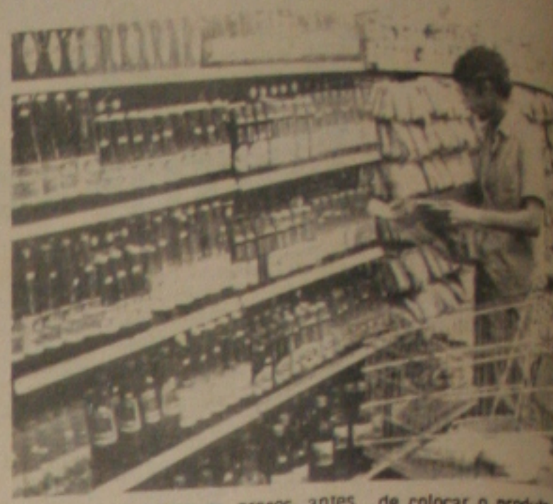
Consumidor confere os preços antes de colocar o produto no carrinho

Os consumidores sergipanos levaram a sério os apelos da Presidência da República, no sentido de que cada cidadão brasileiro seja um fiscal do Sarney e estão indo às compras munidos da tabela de preços para assim poderem controlar o congelamento decretado desde o final de fevereiro passado. Embora, esse número de fiscais ainda seja muito pequeno em relação ao número de consumidores no Estado, é comum encontrarmos pessoas que fazem questão de conferir o preço de cada produto adquirido para não serem lesadas pelos comerciantes que insistem em contrariar o decreto que determina o congelamento dos preços durante o prazo de um ano.