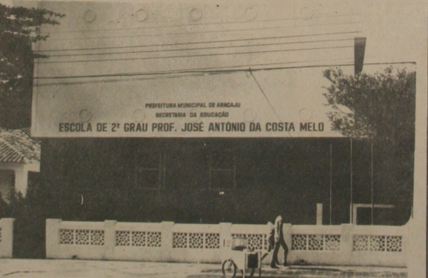
A nova unidade escolar atenderá a 400 novos estudantes.

A reforma dessa unidade de ensino é o cumprimento de uma promessa feita pelo Prefeito Jackson Barreto, quando ainda em campanha anunciou a proposta. Antes, a Escola José Antonio da Costa Melo funcionava na Praça João XXIII, ao lado da Estação Rodoviária Velha, mas as precárias instalações e o intenso movimento do trânsito prejudicavam enormemente o aprendizado dos alunos. No ano passado o então candidato a Prefeito Jackson Barreto visitou suas dependências e prometeu resolver a difícil situação. Na terça-feira ele entregou a escola aos alunos, funcionando agora na esquina da rua Lagarto com a Avenida Barão de Maruim.