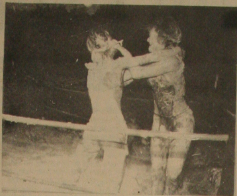
Em São Paulo, as mulheres brigam na Lama, numa boite de grande expressão da vida noturna.