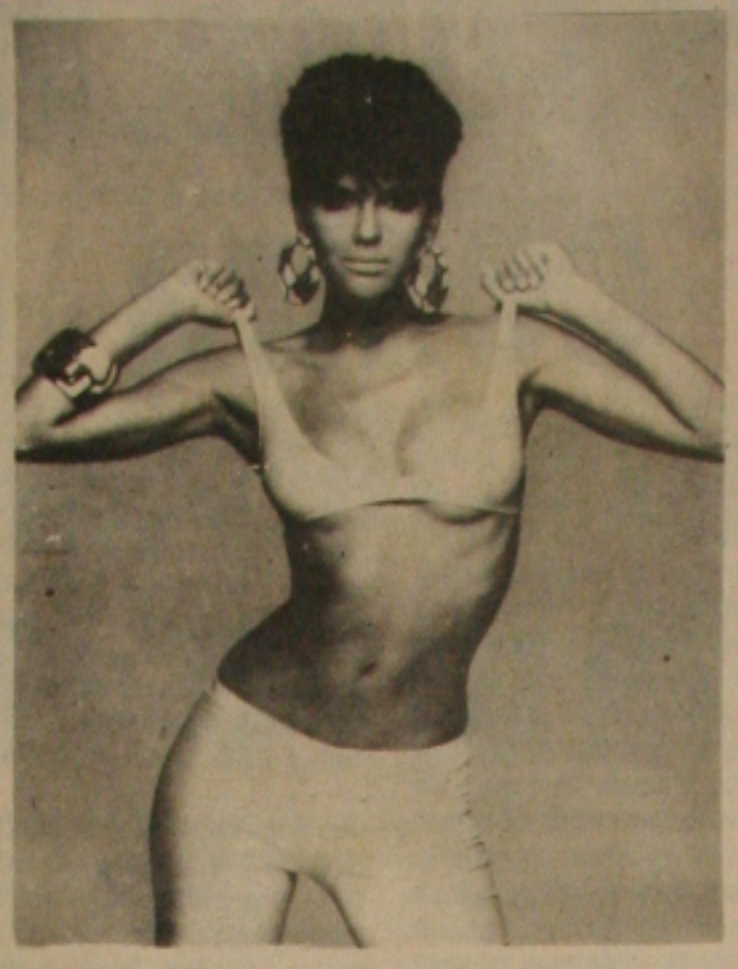
Olha que lançamento da "Tops" para o alto verão 86. Toda essa beleza você vai encontrar na KANOA.