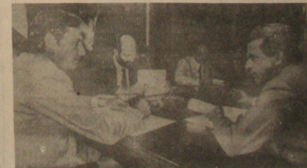
Os Ministros Dilson Funaro, João Sayad e Iris Resende durante a reunião de ontem do

Até o final da semana, o Governo, através da COBAL, divulgará licitação para a compra no mercado interno de 150 mil toneladas de carne para a formação de seus estoques deste pro-