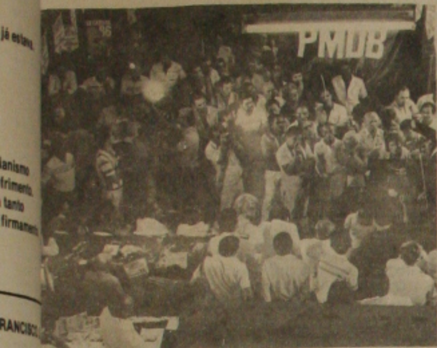
foi tumultuada mas bastante representativa.