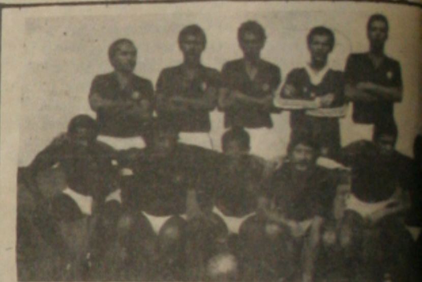
O Flamengo da cidade de Nossa Senhora do Socorro, quer brilhar no Torneio Intermunicipal SESI.

O Flamengo Futebol Clube da cidade de Nossa Senhora do Socorro, treinará hoje à tarde, no Estádio Hely Nascimento, visando a sua participação em várias competições que terá pela frente. O rubro negro socorrense se prepara com afinco, pensando brilhar no próximo Torneio Intermunicipal que será promovido pelo Serviço Social de Indústria.