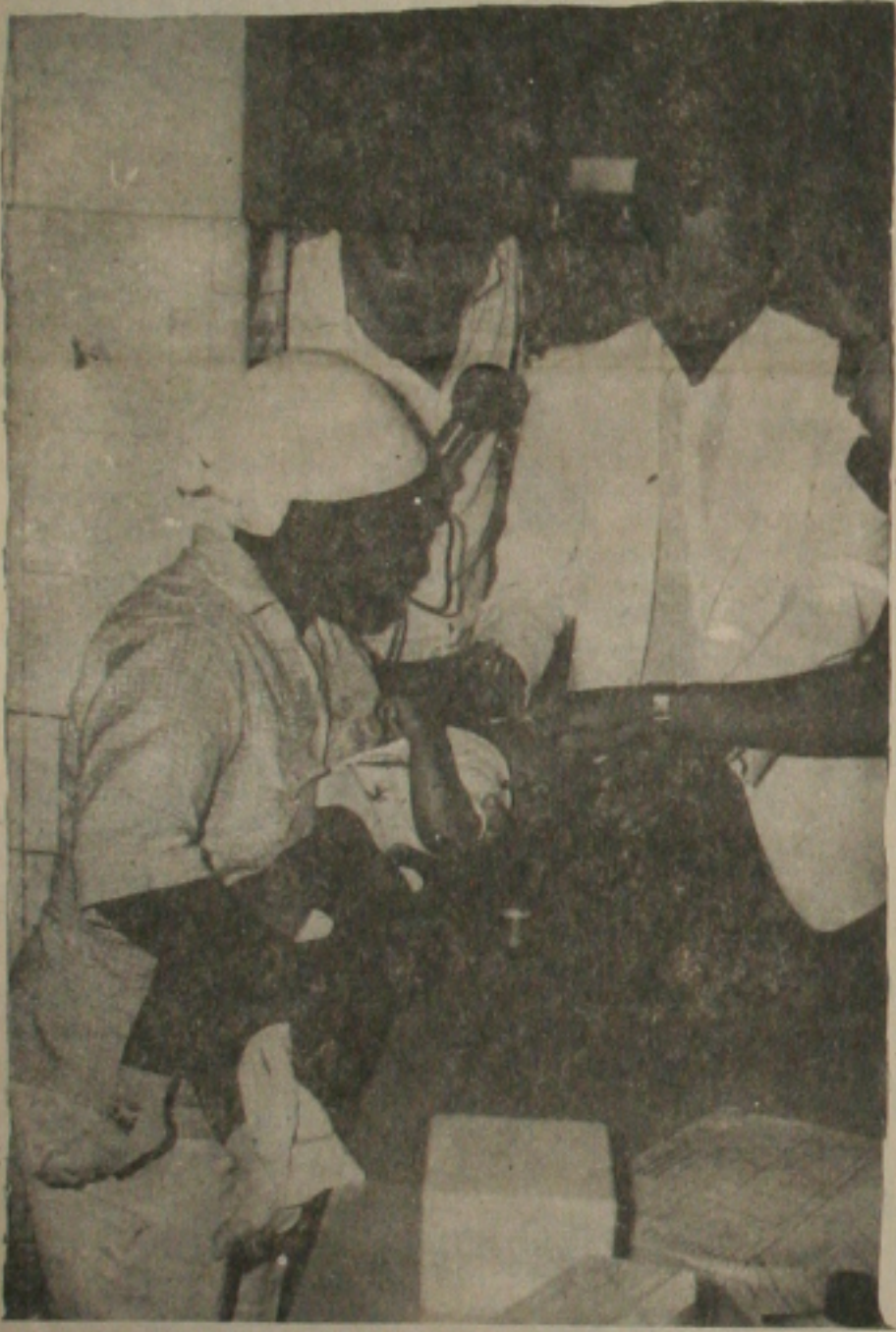
Crianças são vacinadas antecipadamente em Aracaju.

Foi aberta ontem em Aracaju, às 8h da manhã a campanha de vacinação Bloqueio contra a poliomielite. Logo cedo os pais se dirigiam para os 39 postos fixos da Secretaria de Estado da Saúde, espalhados na capital para imunizar seus filhos contra a paralisia infantil. Mesmo já vacinadas, todas as crianças de zero a cinco anos que residem em Aracaju deverão tomar mais uma dose da vacina para combater o vírus da poliomielite até o dia de amanhã. A informação é do secretário José Alves Nascimento.