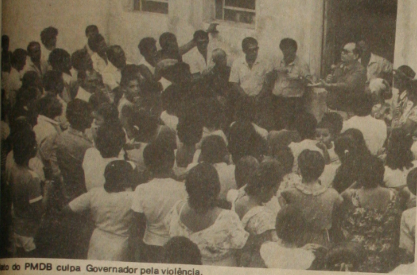
Foto do PMDB culpa Governador pela violência.