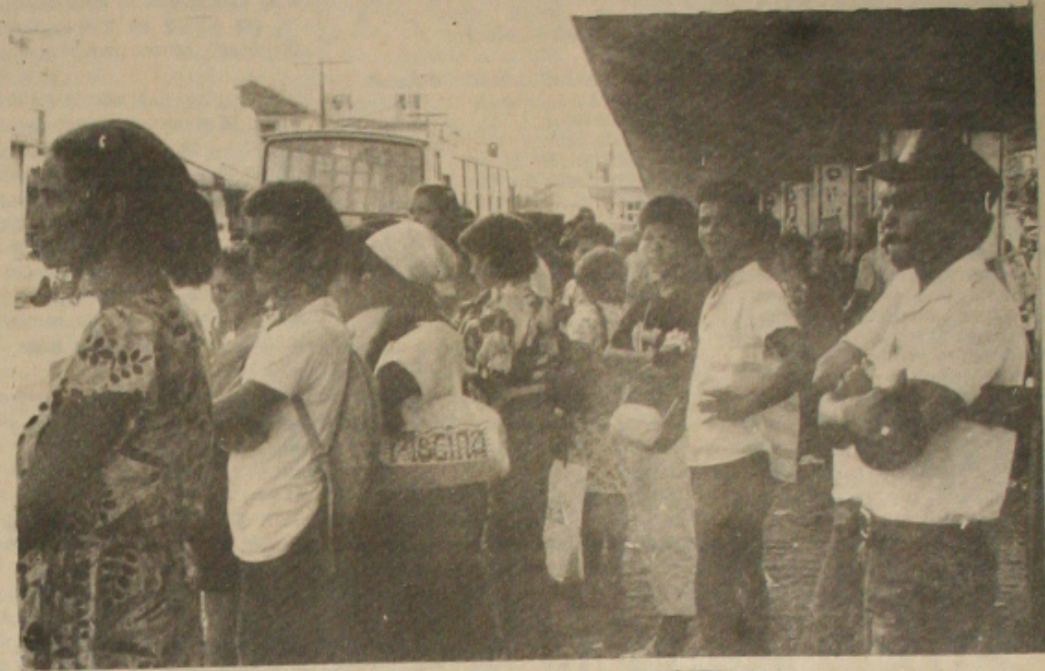
O povo esperou, durante quase toda a tarde os ônibus que não circulou por causa da greve.