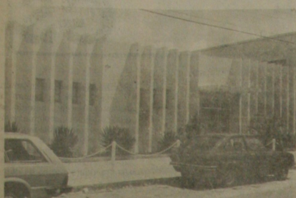
A fachada das instalações do Jornal da Cidade, no bairro Industrial.

Um assaltante morreu atingido com dois tiros e outros dois fugiram sem serem identifica-