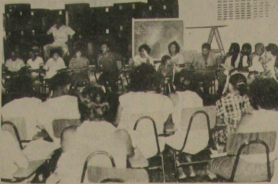
O prefeito Jackson Barreto prestigiou o I Encontro de Artesãos.

Avaliação das Unidades Produtivas da Prefeitura de Aracaju visando a reativação das mesmas e traçar os planos de trabalho para 1986. Estes foram os objetivos básicos do 1º Encontro dos Artesãos das Unidades Produtivas, realizado domingo das 8:30 às 16 horas, no Centro Social Jardim Esperança. O Encontro foi promovido pela Prefeitura Municipal de Aracaju, através da Secretaria de Ação Social e Projeto Aracaju, obtendo bastante sucesso pois os participantes pediram que outros fossem realizados, para que a troca de experiências continuasse.