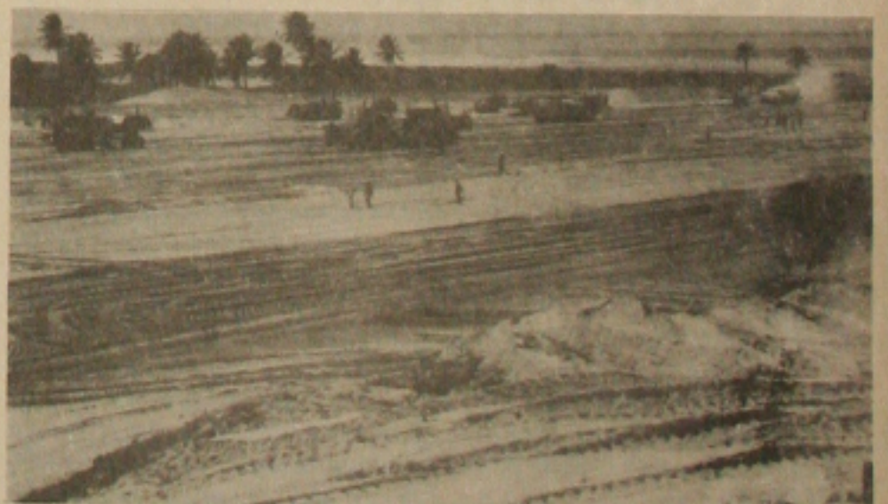
O retroporto ficarão nesta área.