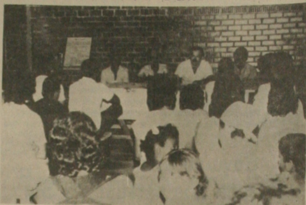
Superintendente se reúne...