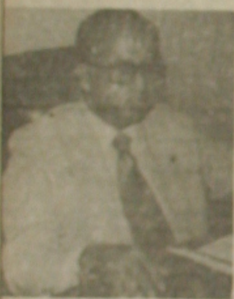
O delegado regional do Ministério da Educação em Sergipe.

treinamento profissional, ensino supletivo entre outros projetos igualmente importantes.