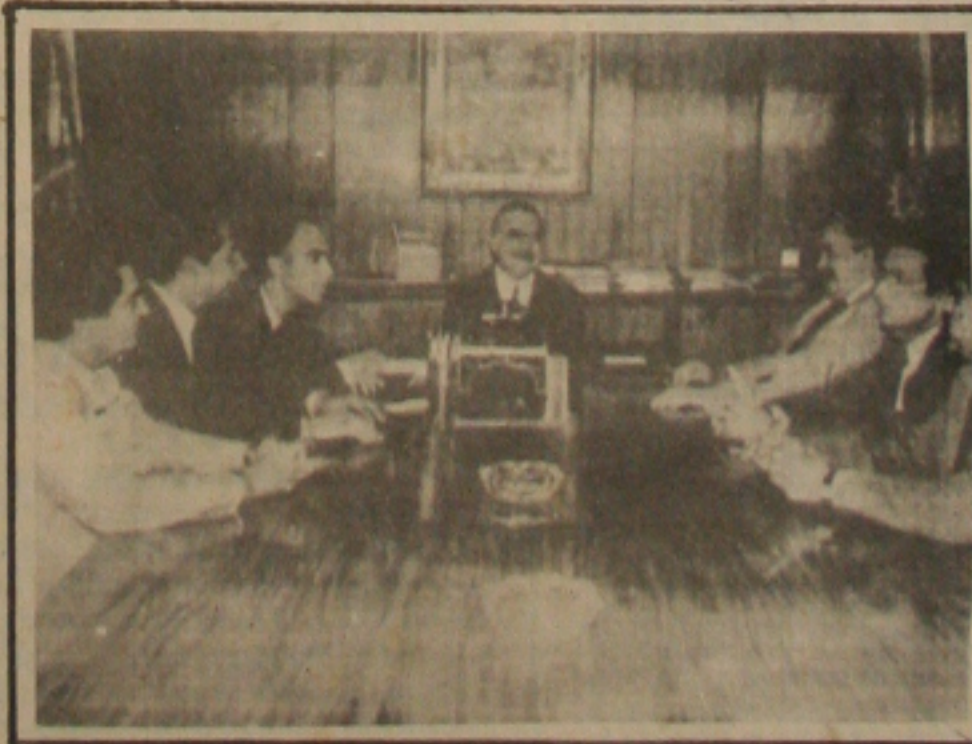
Conselho Político decide por esforço.

Durante a reunião de hoje do Conselho Político, o Presidente Sarney fez um relato de sua viagem a Portugal e Cabo Verde a qual considerou bastante positiva. Segundo Pimenta da Veiga, o Presidente Sarney informou que a posição do Governo é no sentido de melhorar o relacionamento do Brasil com os países africanos, principalmente os de língua portuguesa e, em especial, com Angola. O líder do PMDB na Câmara aproveitou para informar a boa repercussão que teve, no Brasil, o discurso no qual ele repudiou o regime de "apartheid" praticado pela África do Sul.