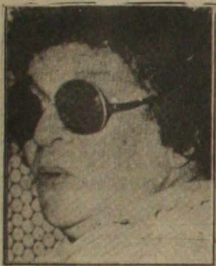
Aracy: novena para o glorioso Santo Antônio.