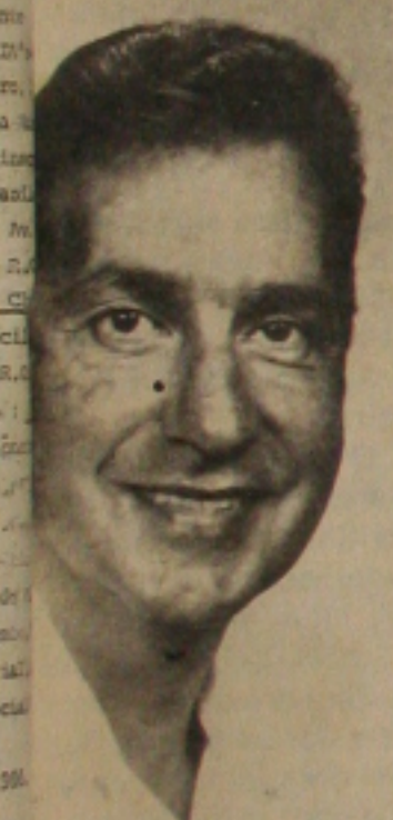
Goes num close de muita do Stúdio Osmar.