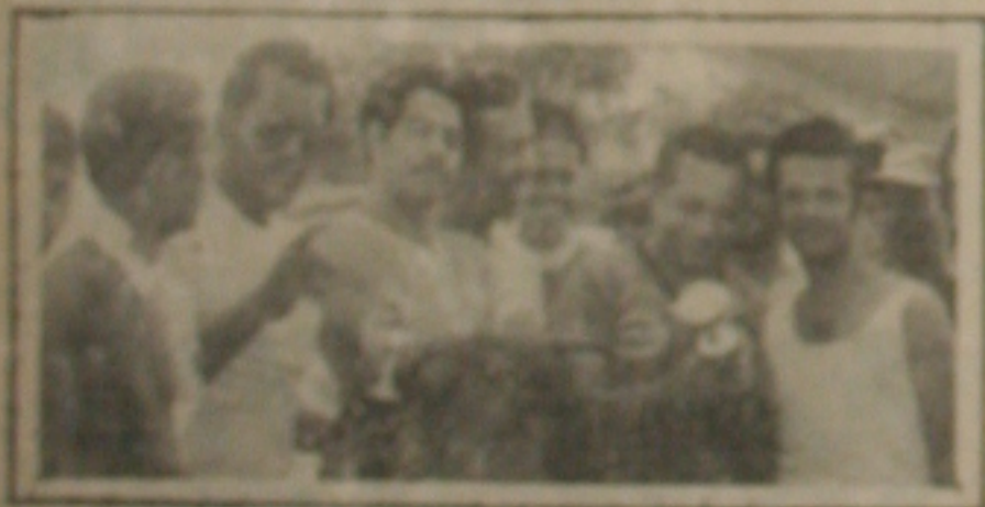
Na foto: O técnico brasileiro, mestre em chutes certos.