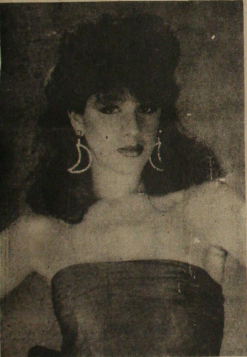
bela Cláudia Raia fazendo falô de vídeo global. Depois de Roque Santeiro, este pedaço de mal caminho tomou um chá de sumiço.