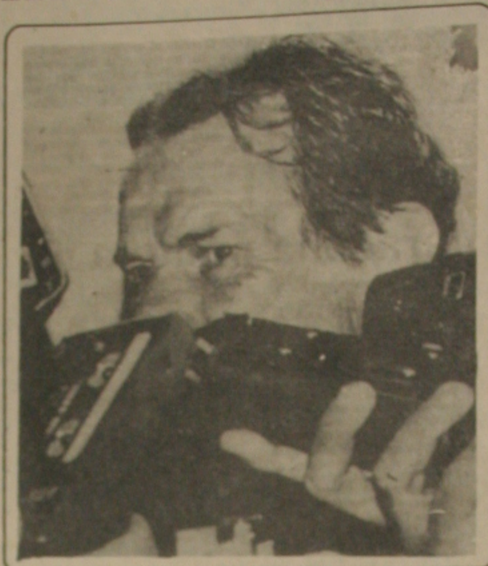
Pelé ainda acredita no trabalho de Telê.