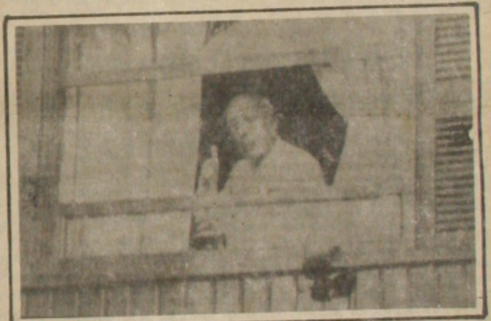
Ulysses garante que está bem, aos jornalistas.

"O Dr. Ulysses Guimarães submeteu-se a exame médico completo cujo resultado apresenta quatro achados de pequenas proporções: 1 - hérnia de hiato diafragmático, 2 - gastrite crônica, 3 - prolapso de válvula mitral e 4 - artrose cervical. Para este quadro clínico está sendo recomendada medicação específica. Este diagnóstico absolutamente não limita sua atividade, muito menos implica em qualquer risco para o paciente. Portanto, o Dr. Ulysses Guimarães sai do INCOR com a apreciação