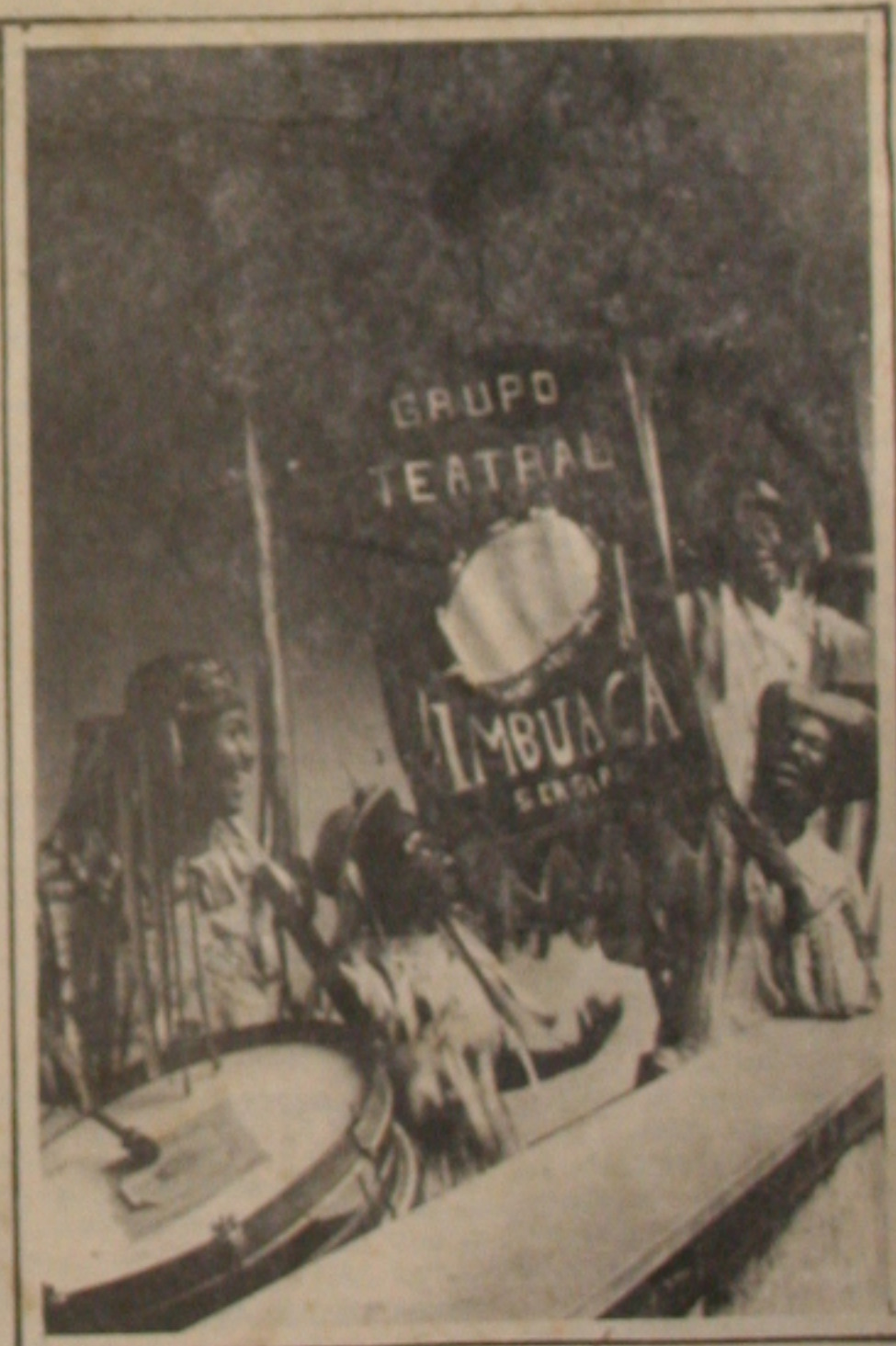
Fac-símile do cartaz utilizado pelo grupo em Portugal.

O Grupo Teatral Imbuuça, juntamente com outros três dos estados do Ceará, São Paulo e Rio de Janeiro, viaja hoje para a cidade do Porto, Portugal, onde participa do Festival Internacional de Teatro e Expressão Ibérica. Do Porto, o grupo segue para Coimbra para realizar apresentações atendendo solicitação de pessoas ligadas ao teatro e que têm interesse em conhecer a experiência desenvolvida pelo Imbuuça em Sergipe.