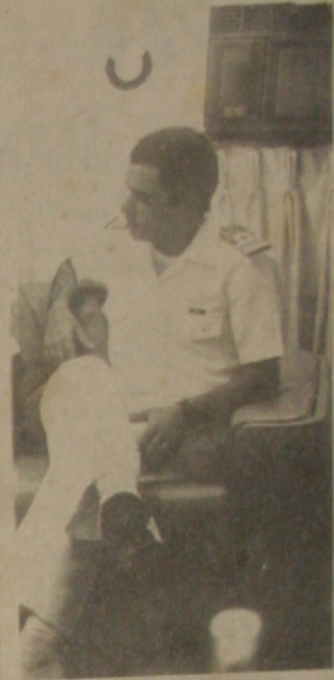
TRAVESSIA ALMIRANTE BARROSO

A Capitania dos Portos do Estado de Sergipe, em francos preparativos, visando o sucesso da IV Travessia Almirante Barroso, a ser realizada, no dia 1º de junho, no estuário do Rio Sergipe. O Capitão de Corveta, o carloca Neyl Frões de Almeida (foto), Comandante da Capitania dos Portos do Estado de Sergipe, nos próximos dias, reunirá a imprensa para dizer quais são os objetivos da Travessia Almirante Barroso.