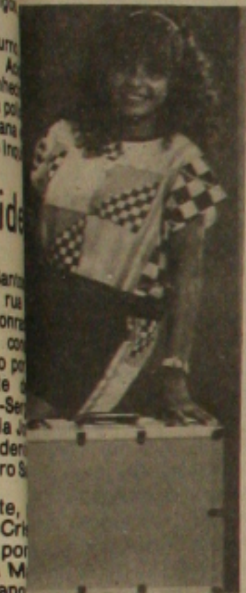
me e simpatia de Dalva Oliveira.