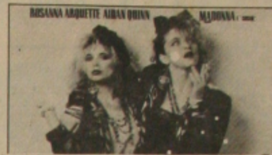
"PROCURA-SE SUSAN DESESPERADAMENTE" (Desperately Seeking Susan)