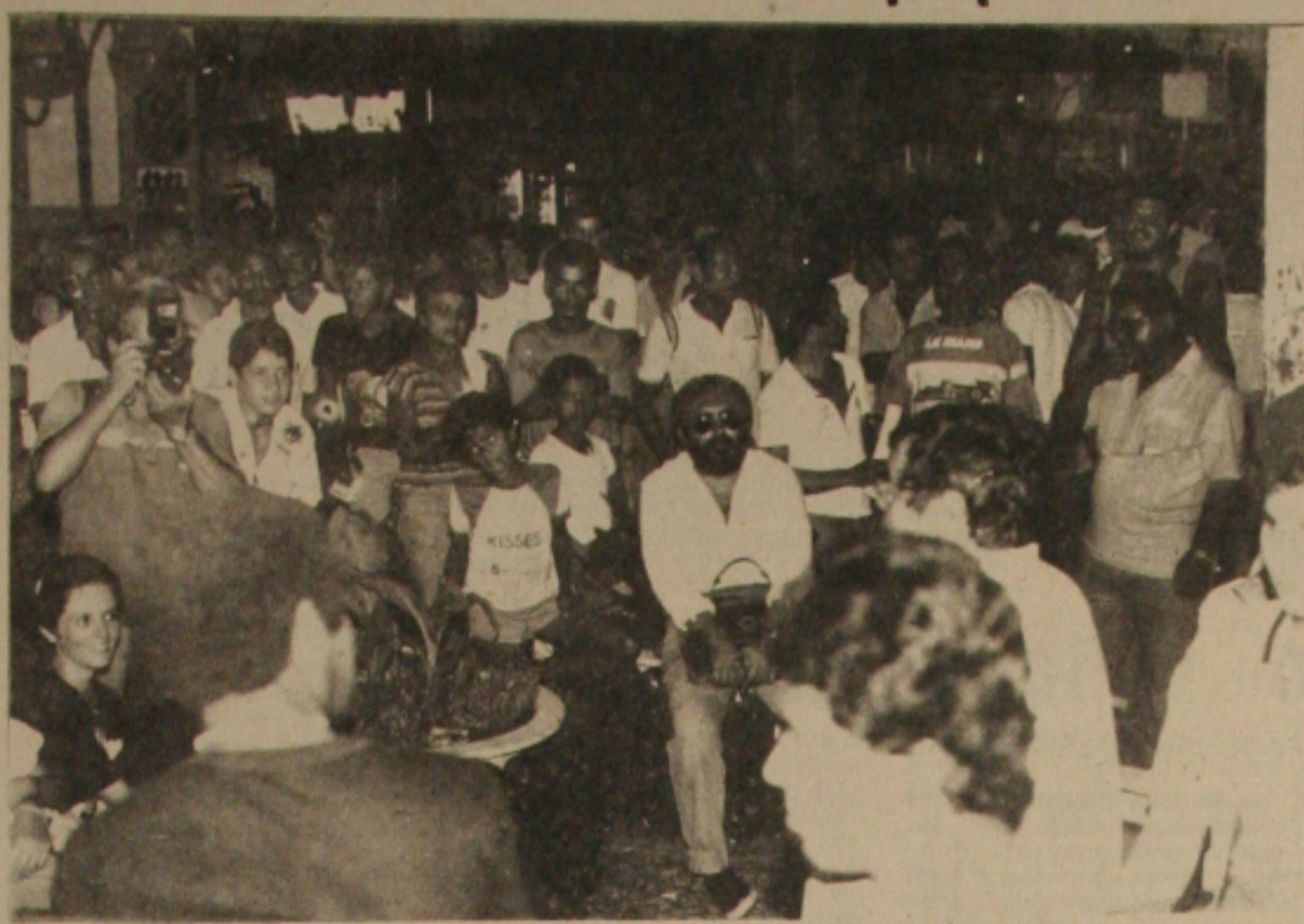
Trabalhadores presentes no lançamento das candidaturas do PT

Um ato público realizado na rua João Pessoa, do dos Trabalhadores - ontem a tarde, o lançamento das candidaturas aos cargos majoritários e proporcional - contou com a presença de centenas de trabalhadores rurais e urbanos, das do Partido, candidaturas populares que aderiram à estação. Quando que não tem dinheiro para fazer festas faraônicas, o PT fez o lançamento das candidaturas, o PT fez programação simples e objetiva, quando os candidatos apresentaram suas propostas. A Constituinte foi o principal dos candidatos ao Congresso, com todos dando a importância de dar um amplo debate aos conselhos dos trabalhadores e a nova Carta Constitucional.