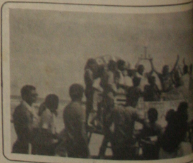
A Equipe Gelo, vira com o título conquistado