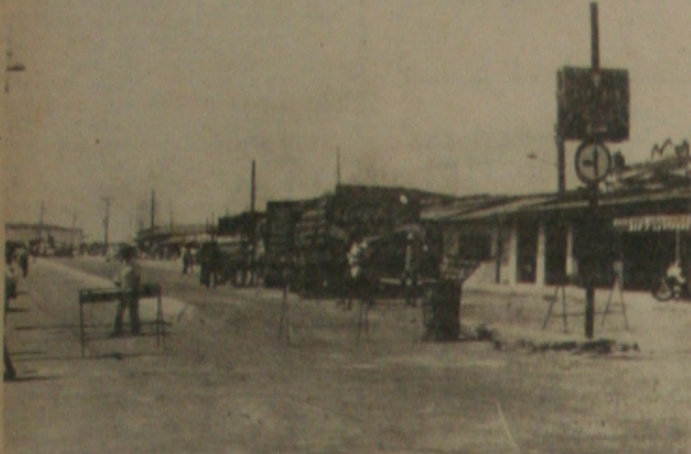
Os feirantes não estão gostando do anel viário construído pela Prefeitura, mas a Seturb garante que está fazendo o melhor naquela área.

Prefeitura, mas a Seturb garante que está fazendo o melhor naquela área.