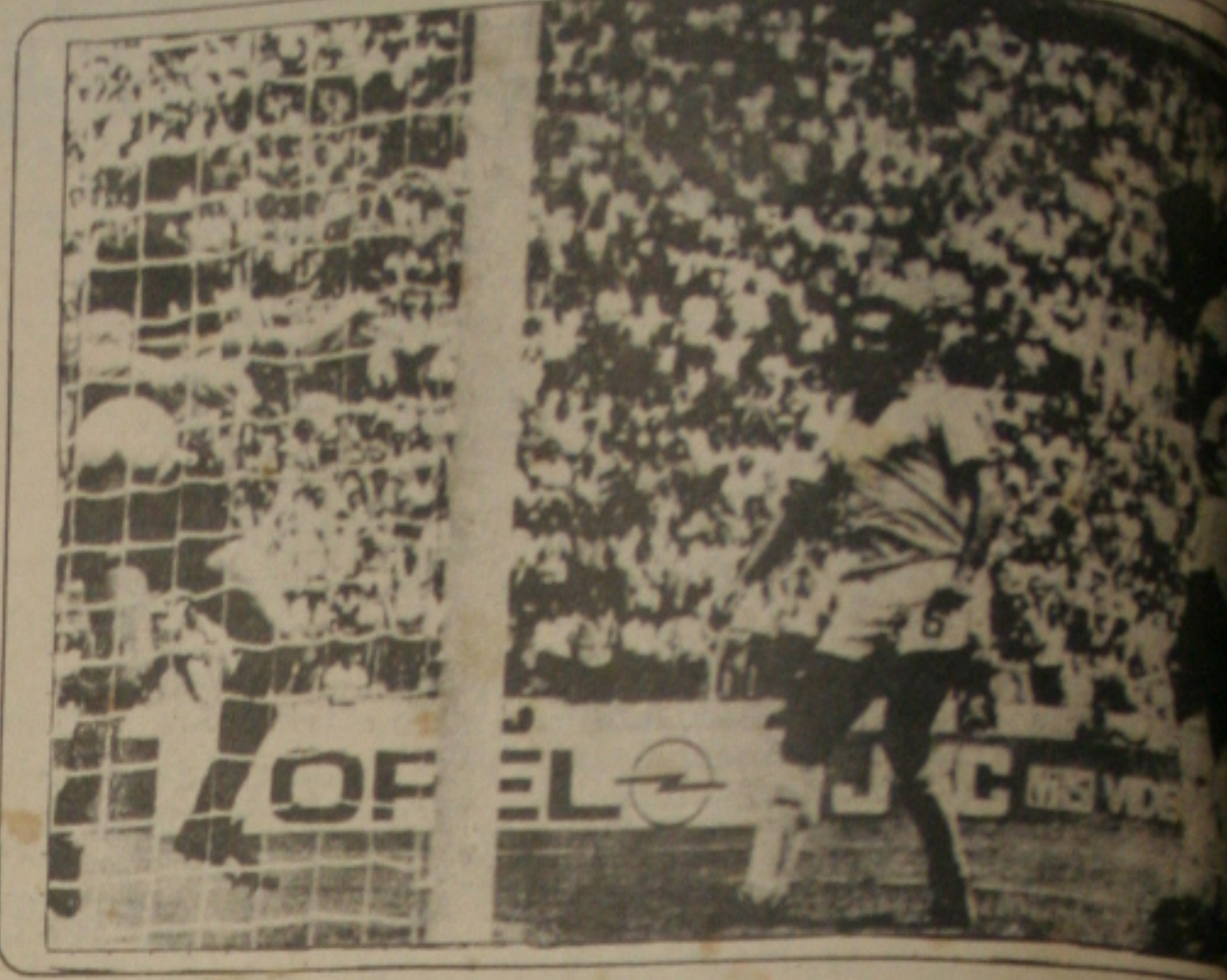
Sócrates, de cabeça marca o gol da vitória brasileira.

Por essa tática, Casagrande, marcado por três espanhóis - o lateral direito Tomas, o central Camacho e o volante Munoz - foi