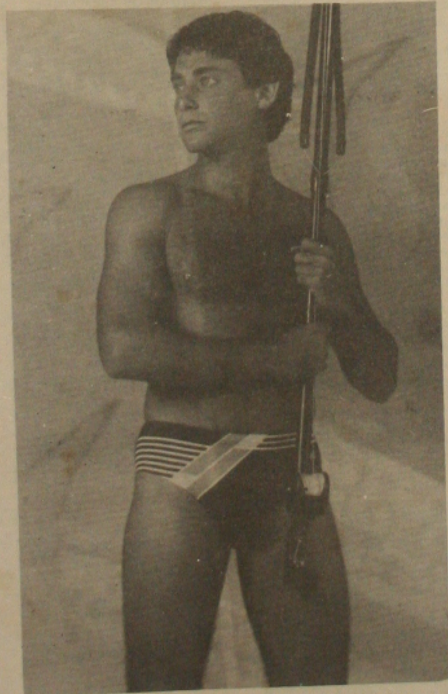
Peças para todos os gostos masculinos na Coleção Swim 86/87, que você deve encontrar na KANO.

O último lançamento de Magal ganhou repercussão por causa da festa badalativa que realizou em sua casa, que foi um verdadeiro fuá e o pessoal só abandonou o salão de festas quando ele começou a cantar. Porém, o cantor acha que faltou divulgação que a gravadora não deu a mínima para o disco e por isso fi-