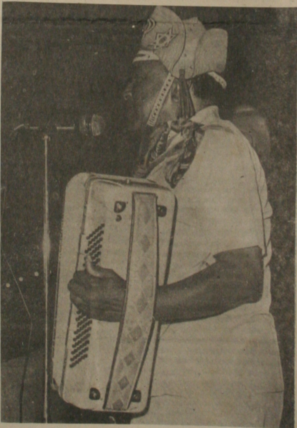
O maior nome da MPB, Luiz Gonzaga, o "Gonzagão", estará entre nós neste fim-de-semana. Não vale perder.

O cantor e compositor Luiz Gonzaga, considerado pela crítica especializada e pelo público em geral como a maior expressão viva da Música Popular Brasileira, estará mais uma vez em Aracaju, no próximo final de semana. Ele vai se apresentar, desta feita - e pela primeira vez - no Circo Amoras e Amores, na Praia dos Artistas, com o show "Fórró de Cabo a Rabo", que é também o título do seu mais recente elepê, já na liderança de vendagem em todo o país. A faixa-título está em todas as paradas musicais das emissoras de rádio AM e FM.