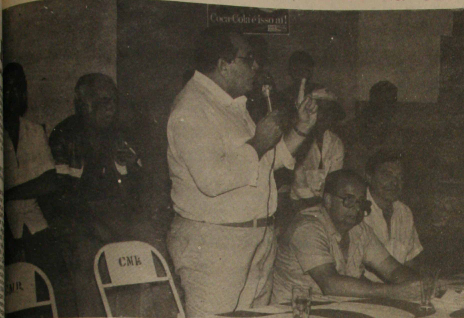
... fala para moradores do condomínio Morada dos Bosques

... preciso mudar, transformar, democratizar. Na hora de escolher o primeiro governador da República, o povo deve saber o seu voto e eleger o candidato que tem uma vitória política pautada pela humildade por um candidato que durante os 21 anos de arcaísmo abriu o seu discurso associados do condomínio da do Bosque, que visitou ontem à noite. Ele transferiu ao povo a responsabilidade de redemocratização e disse o voto secreto tanto eleger derruba governantes, a-