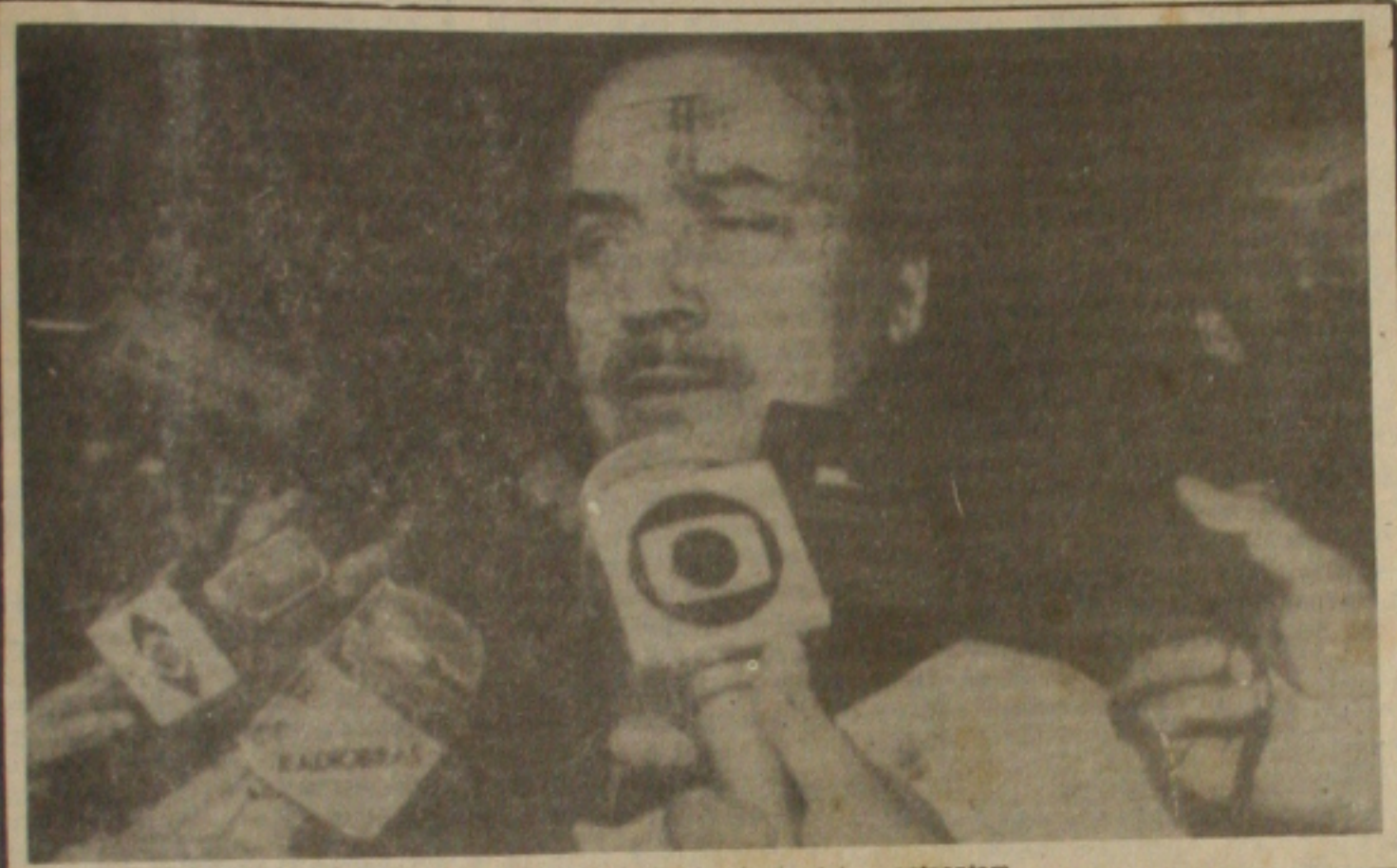
Paulo Brossard fez o alerta através de telex, anteontem.

Governo Federal, através do Ministério da Justiça, Paulo Brossard, poderá intervir no Governo da Bahia devido a onda de violência do Estado. A medida, autorizada pelo Presidente Sarney, foi formalizada em Aracaju por Brossard anteontem. O governador João Durval, no texto, o qual trata de exemplos de crimes im- portantes desde espancamentos, até a morte de Prefeitos já com pedi- mento de vida formalizados, e de carros com a convivência da violência.