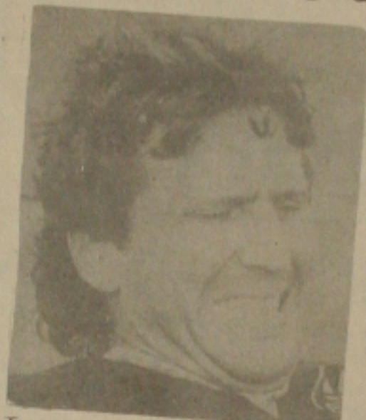
Tratamento não resolveu: Zico será operado

Meio a contra-gosto, até porque continua empenhado em colocar o jogador em condições para disputar ainda alguns jogos do Mundial, o médico Neylor Lasmar já está acertando com Zico alguns detalhes da cirurgia a que o atacante terá que ser submetido, para voltar a jogar normalmente após a Copa.