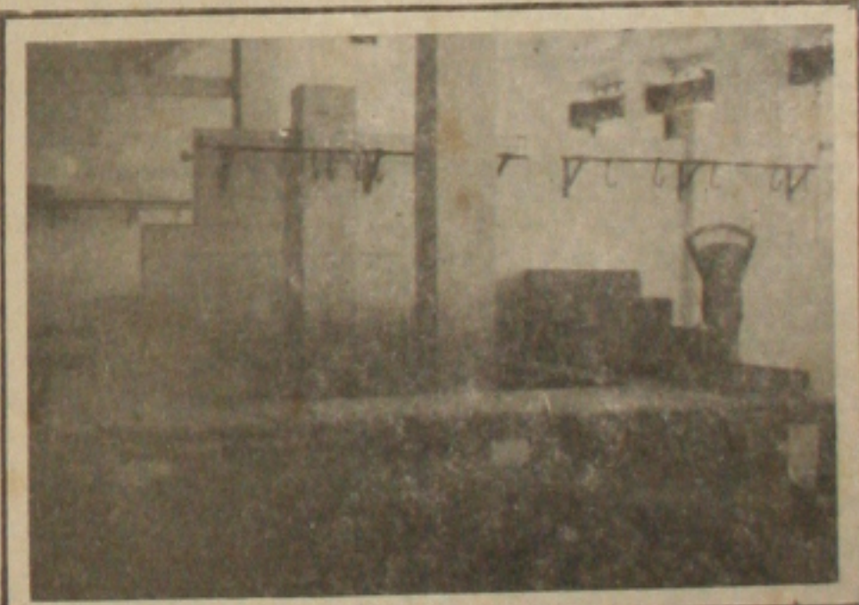
As bancas do mercado central ficaram vazias às 9 horas.

Em virtude da falta de carne bovina em Aracaju os consumi- dores viram-se obrigados a comprar mariscos e galinha para a alimentação diária. Com isso, os comerciantes destes produtos venderam todo o estoque que tinham e, em muitos casos, fecharam o acesso às suas ban- cas.