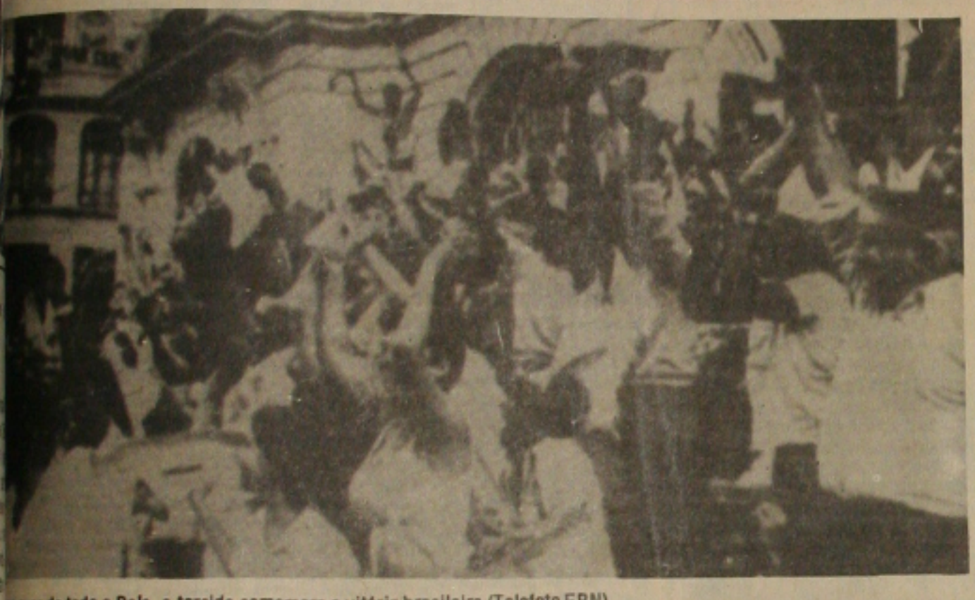
As ruas de todo o País, a torcida comemora a vitória brasileira.

Brasil vence a Irlanda do Norte e é o primeiro lugar do seu grupo