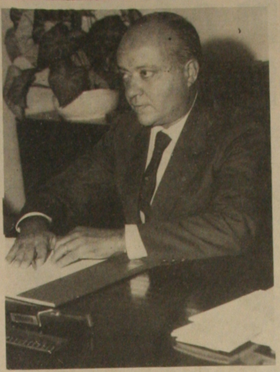
O Vice-Prefeito Dr. Viana de Assis está na campanha para Senador.