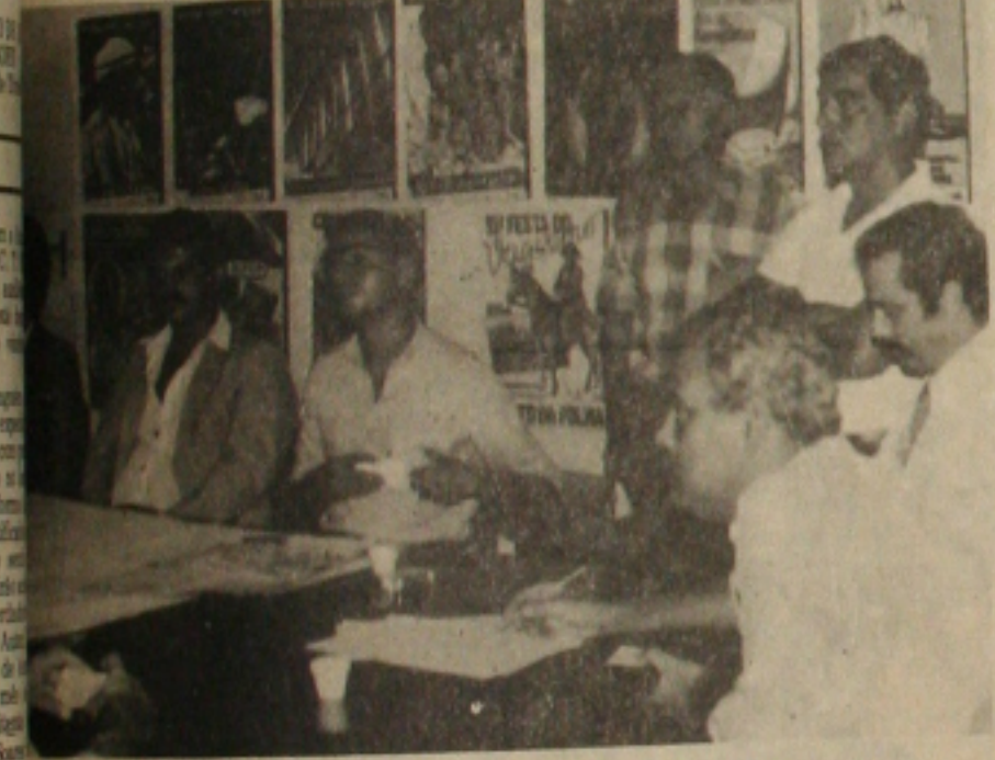
Agentes de viagens, hoteleiros e operadores em reunião da Air France, na EMSETUR.

* Marcelo Mastroianni é o protagonista de uma bela e trágica história de amor. O filme chama-se "O Voo" e se passa numa alfeia