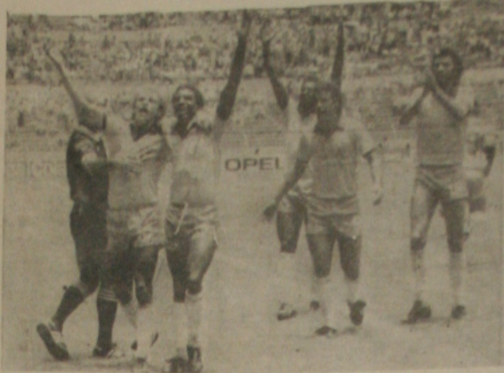
Alegria dos brasileiros pode ser repetida sábado contra a França.

O torcedor brasileiro conheceu ontem à tarde, o adversário do Brasil, nas quartas de final que será disputada sábado, às 15 horas em Guadalajara. Ao vencer a Itália por 2x0, o time francês se classificou para ser o adversário do Brasil. Telê Santana que assistiu a partida comentava o jogo para a rede Globo, disse que o time francês se torna num adversário mais difícil para o Brasil, do que a própria Itália. "Mas estamos preparados para o jogo e quem entra numa copa para ganhar, tem que estar prevenido para enfrentar os mais difíceis adversários".