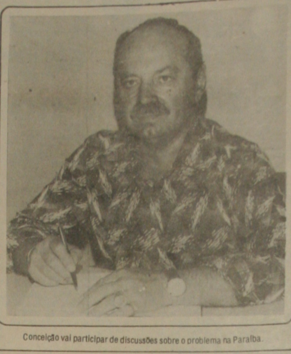
Conceição vai participar de discussões sobre o problema na Paraíba.

Ele acrescentou: "Com isso só uma pessoa tem sido prejudicada, o paciente que as vezes tem que andar muito para trocar a receita por outra e adquirir um medicamento que faça o mesmo efeito".