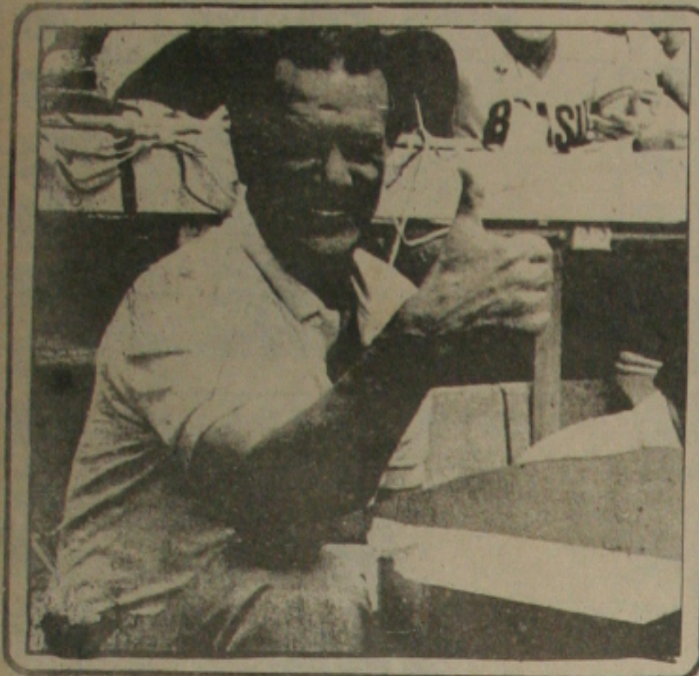
Telê elogia a França, mas acredita na vitória do Brasil.

O treinador Telê Santana que elogiou muito a vitória da França sobre a Itália disse que não foi nenhuma novidade isso porque ele admira o futebol da França e a exemplo do Brasil, os franceses praticam o futebol arte. Sobre os melhores jogadores do time adversário ele não quis fazer muitas referências, mas elogiou muito o futebol de Tigana, Giresse e principalmente o meio campo Michel Platini, para quem o Brasil entrará em campo com um esquema especial de marcação. "É um jogador muito habilidoso e não podemos correr o risco que correu a Itália deixando Platini sem marcação. É a partir dele que a França arma todo o seu esquema de ataque. O meio campo da França é muito bom e tem em Platini o seu principal jogador". Telê não quis dizer quem vai entrar em campo com a finalidade de marcar o astro francês, mas disse apenas que haverá uma marcação especial.