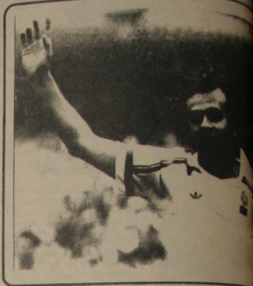
Platini receberá marcação especial

— Um dos grandes erros da Itália foi deixar Platini muito solto, com liberdade para criar a maioria das boas jogadas da França. Não vamos exercer mar-