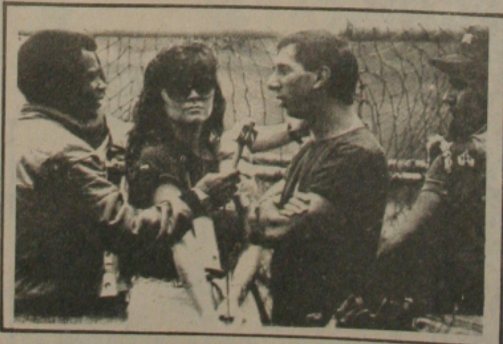
Billardo confia no futebol de Maradona.

O treinador argentino Carlos Billardo já decidiu que o treinamento hoje de sua equipe, no Club América, será fechado para a imprensa. Billardo quer definir algumas funções táticas e jogadas especiais dos argentinos e, desta maneira, não pretende que "espíões alemães", infiltrados entre os jornalistas, descubram quais os truques que pretende empregar contra o time de Beckenbauer.