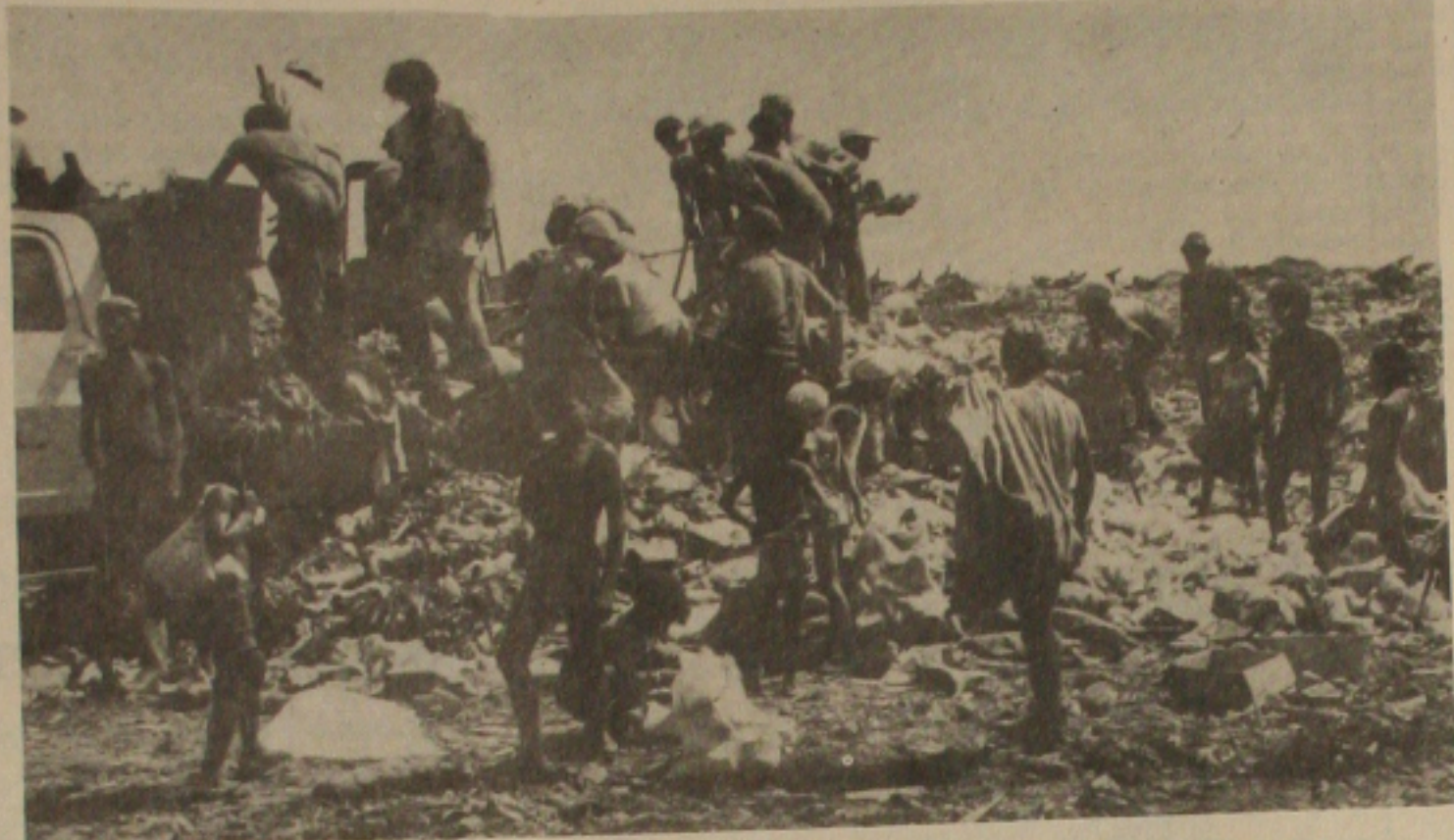
Populares catando lixo na Soledade.

Seixas Dória participa ativamente da campanha de José Carlos. Quando que o ex-prefeito convênio com a Prefeitura de São Cristóvão visando a construção do aterro sanitário, lamentou que o prefeito Barreto, apesar das promessas em praça pública, não tenha feito para solucionar o grave problema a que é submetida os moradores da Soledade.