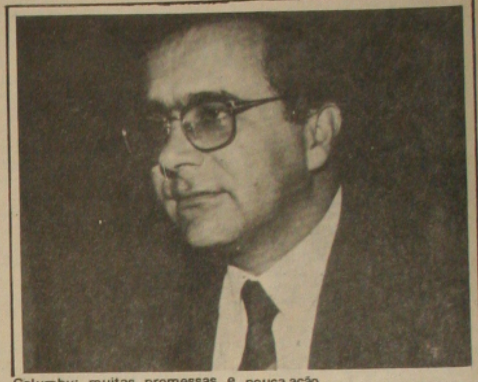
Calumby: muitas promessas e pouca ação.

Há três meses atrás, o superintendente do INAMPS, em entrevista à imprensa sergipana anunciava as mudanças que estava promovendo que contribuíam para dar fim às filas. As filas, segundo vários previdenciários, continuam e ainda por cima passou a existir a figura do "cambista".