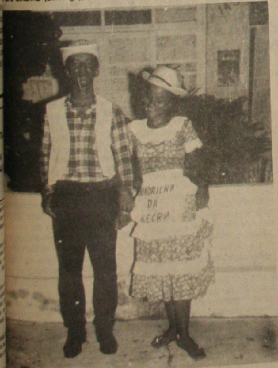
A quadrilha de matutos continua sendo as grandes atrações das festas juninas.