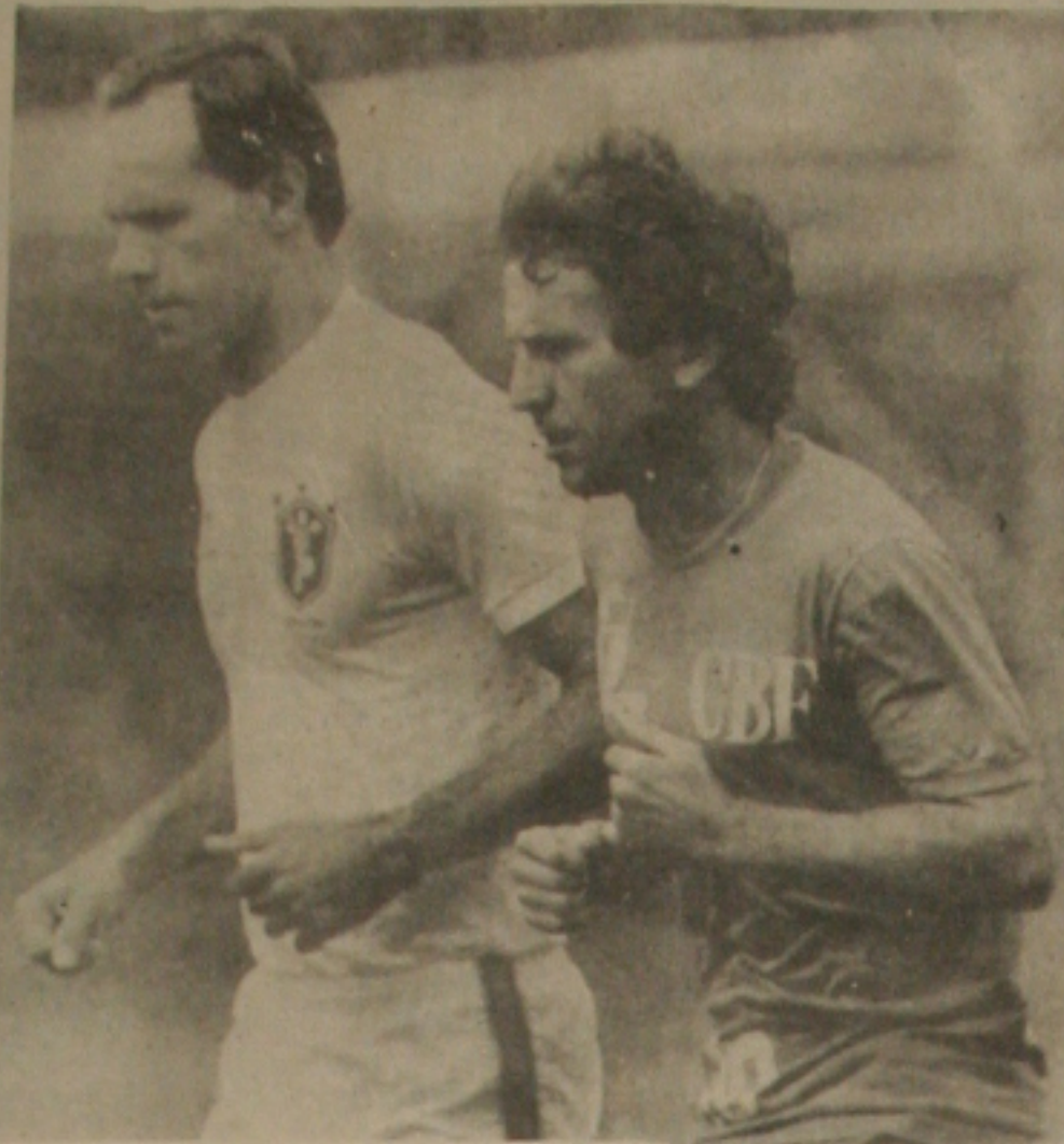
Zico antes do bom treino um aquecimento com o preparador físico.

Mas durante todo o treino as atenções dos presentes ao Bosque Primavera estavam voltadas para o atleta Zico. Ele pelas suas condições que ainda não são ideais para uma partida tão