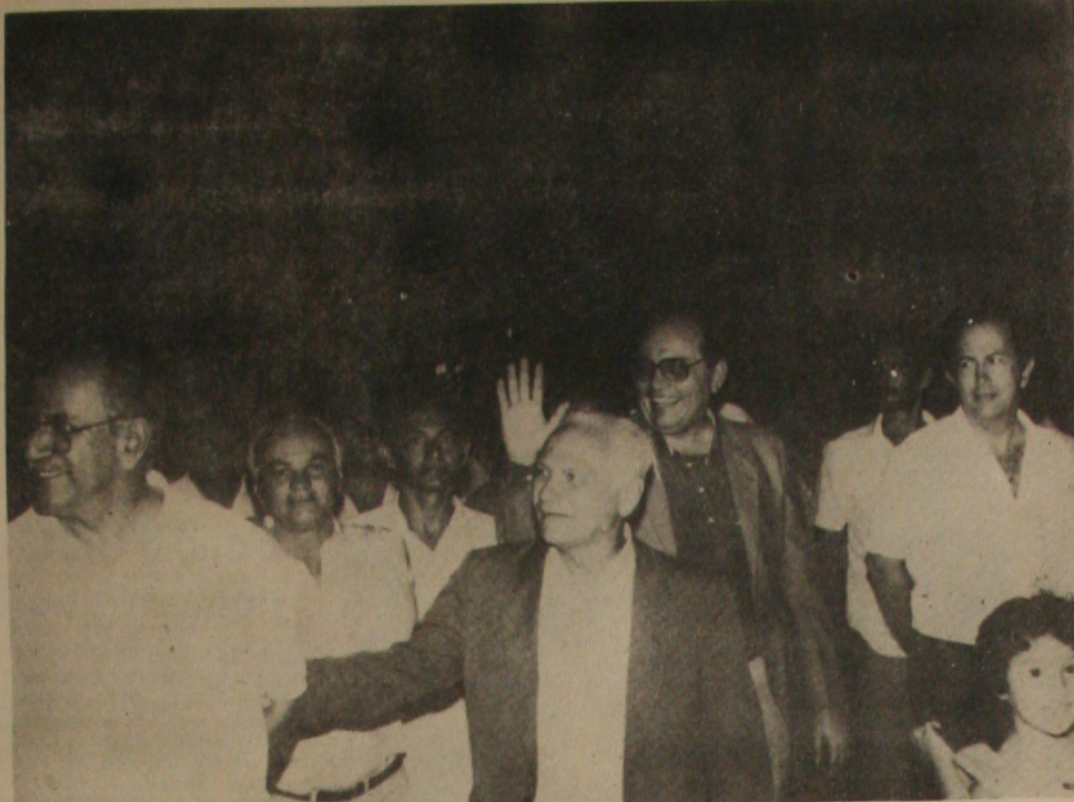
Candidatos do PMDB em plena campanha.