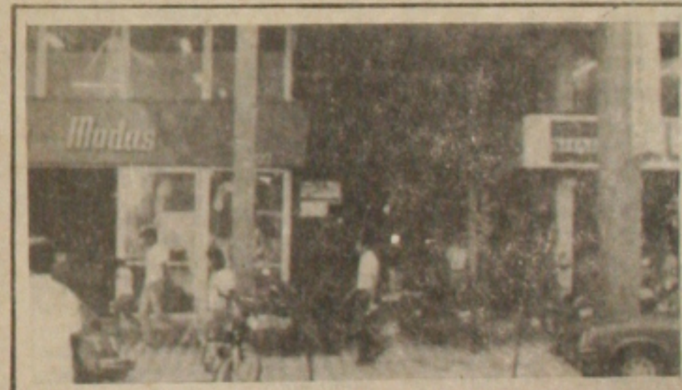
No Edifício Jangada não existe garagem e as motos ficam na calçada.

Os proprietários de motocicletas que residem no Edifício Jangada localizado à rua São Cristóvão, 212, centro, estão preocupados com a ação contínua de marginais que se especializaram em furtar peças dos veículos e, na maioria das vezes desligam os cabos dos freios provocando, em alguns casos, acidentes. No início, o caso foi levado ao conhecimento da Secretaria de Segurança Pública, que começou a investigar o roubo, mas depois colocou uma "pedra" sobre o problema.