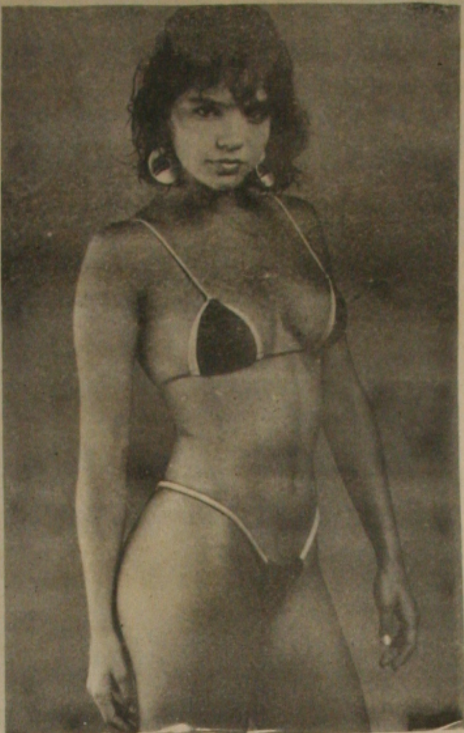
Karla uma gatinha carioca que veio passar os festejos juninos entre nós.