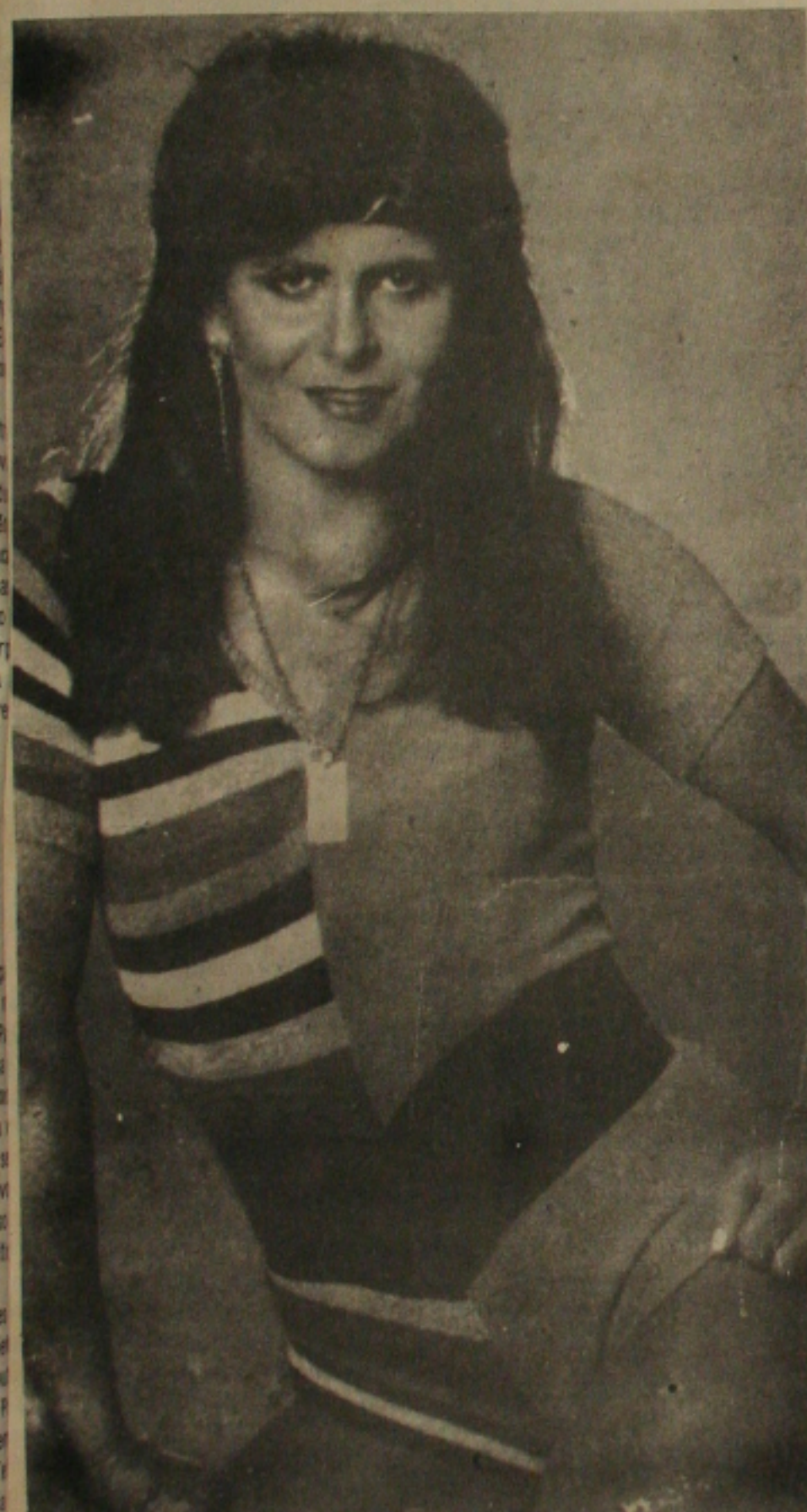
A cantora Gretchen vai rebolar na Justiça.

Segundo alega a reclamante, Gretchen a dispensou sem pagar o aviso-FGTS, férias e 13º que tinha direito, dívida que atualmente é calculada em 22 mil cruzados. O julgamento do processo ocorreu na segunda-feira e Gretchen deverá pagar tudinho dentro de curto prazo, conforme decisão da Justiça.