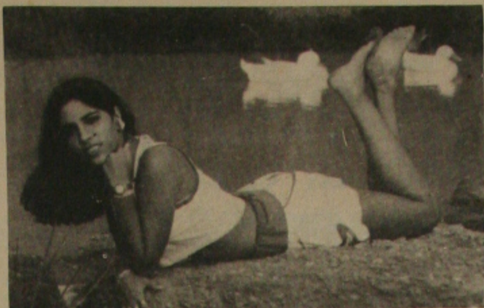
Luciana Monteiro Pinheiro um mimo de garota pontificando na coluna de hoje.