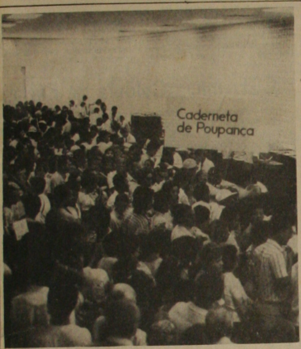
As longas filas já são previstas pelos bancários sergipanos

A nota esclarece que a redução das despesas de funcionamento das agências permitirá a manutenção, em escala maior, do quadro de pessoal dos bancos, pois reduz sensivelmente as despesas para prestação de serviços.