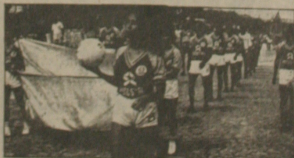
Sesi na Olimpíada de Blumenau