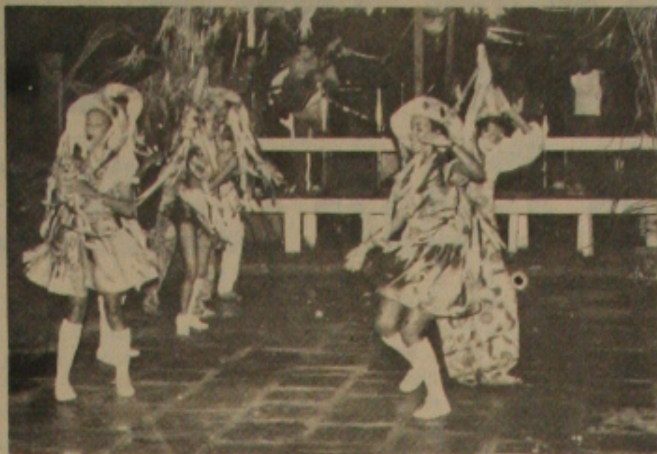
Este é o Grupo CAÇUA, que hoje à noite vai está no Parque dos Coqueiros.

Com 80 vôos e 5600 passageiros transportados em média nesse período, a VASP é a única empresa aérea a operar em Fernando de Noronha através de fretamentos da Bancor, responsável pela comercialização dos pacotes turísticos.