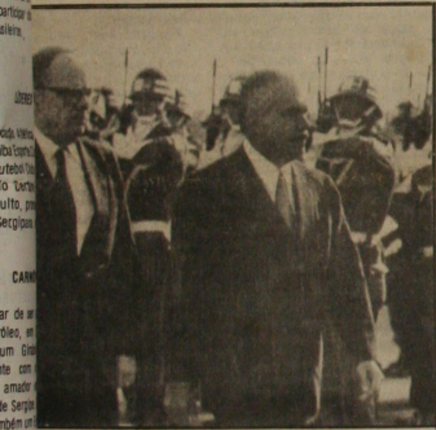
Uma tropa em revista na Base Aérea de Brasília.

Muylaert disse ainda que desde que chegaram aos ouvidos do Governador Franco Montoro, as primeiras reclamações de boias-frias com relação à severidade que vinha sendo usada pela PM para reprimir o movimento, ele (Montoro) determinou a instituição agir dentro de toda a moderação, "que é a linha habitual do Governo do Estado. Segundo Muylaert, já na noite de anteontem policiais foram agredidos a pedradas e na manhã de ontem, apesar dos esforços em contrário, o conflito acabou eclodindo. Muylaert garantiu que quem quer que tenha dado origem a toda essa violência, terá que responder pelas consequências de seus atos. (página 07)