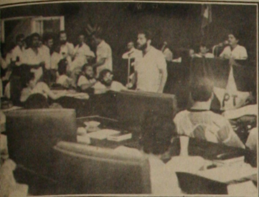
preferendou nomes dos candidatos