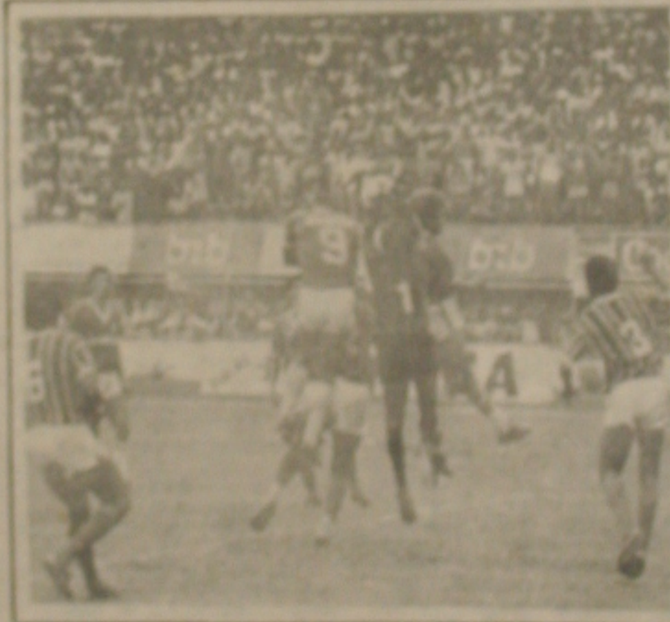
Defesa de Itabaiana quer terra e ataque proibido