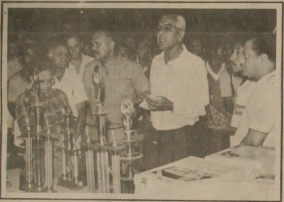
O diretor regional do SESI falando no encerramento do torneio início.