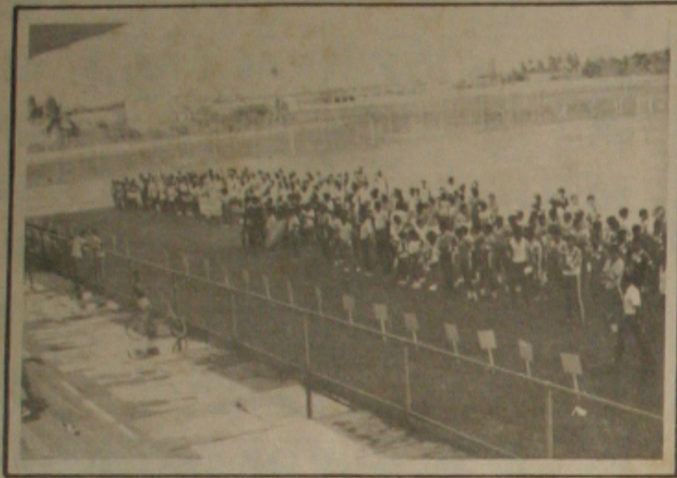
As equipes que participaram do desfile do torneio início.