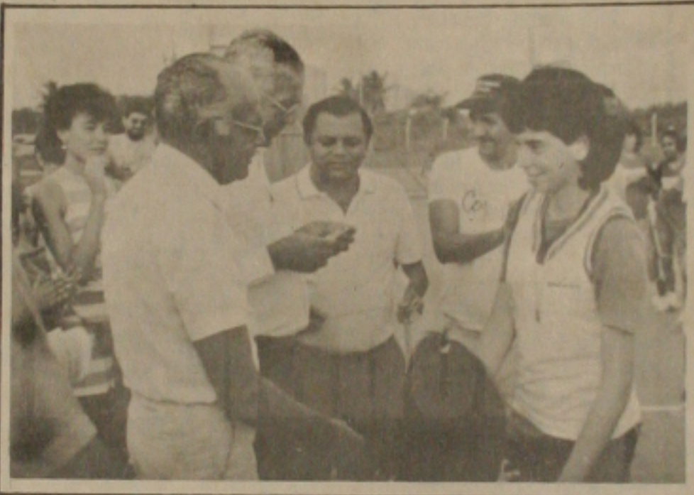
As garotas vitoriosas do vôlei quando eram premiadas com medalhas.