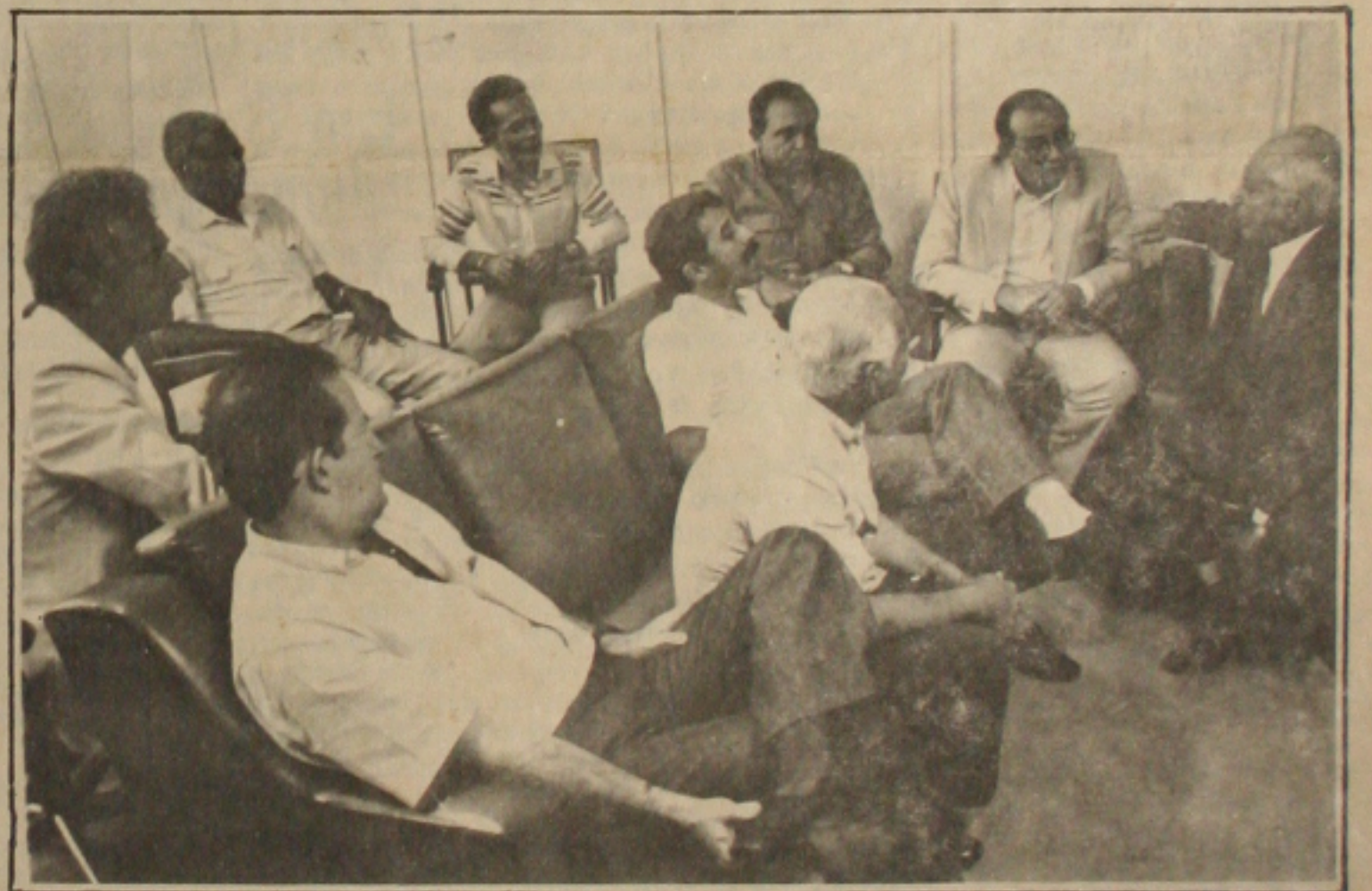
Ontem, a bancada sergipana no Congresso Nacional denunciou irregularidades no Tribunal de Contas de Sergipe.

A Assembléia Legislativa do Estado endereçou ontem telex às autoridades federais demonstrando preocupação com a falta de cumprimento da lei que desde o início do mês passado proibiu as contratações. Também preocupado com a questão o presidente do TCE vai apurar as denúncias. (página 05)