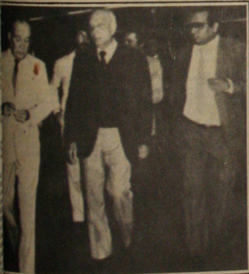
Guimarães desembarca no Aeroporto de Brasília

Presidente do PMDB e da deputado Ulysses Guimarães, afirmou ontem, ao chegar a São Paulo, que o partido está trabalhando para ganhar as eleições no seu plano de atuação com o objetivo que terá delegações por ele (Ulysses), estes Quêrcia, Mário Co-Fernando Henrique Car-cuja atuação se voltará interior do Estado.