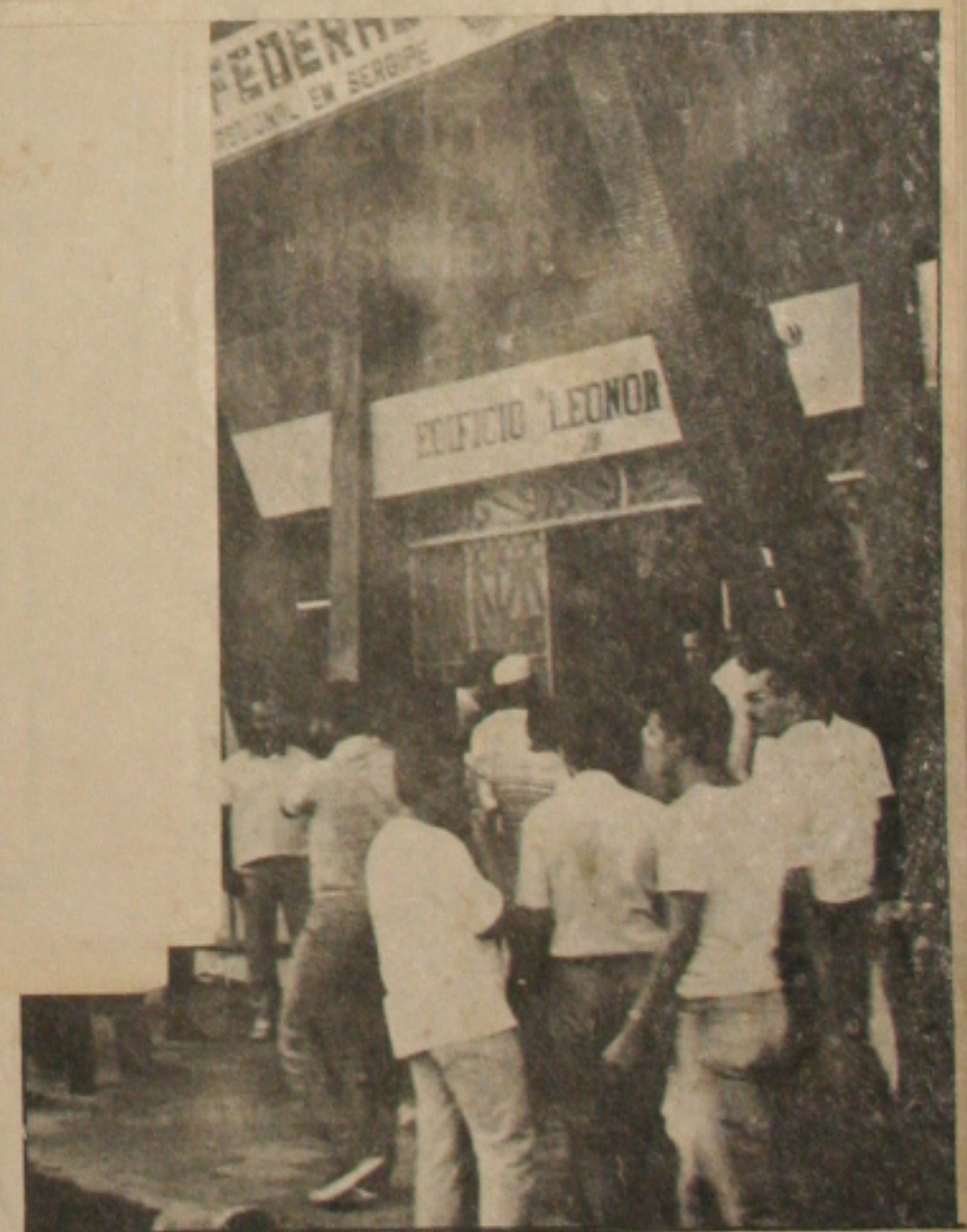
Ontem pela manhã, todos os vendedores ambulantes foram detidos.

afetam o setor "tem sido muito bom e proveitoso". O senador esteve ontem em Curitiba participando da solenidade de abertura do Seminário Brasileiro sobre Meio Ambiente do Trabalho que vai discutir questões relacionadas a segurança do trabalho e a saúde ocupacional. —Os problemas de abastecimento de alguns produtos industriais são questões emergenciais e plenamente contornáveis.