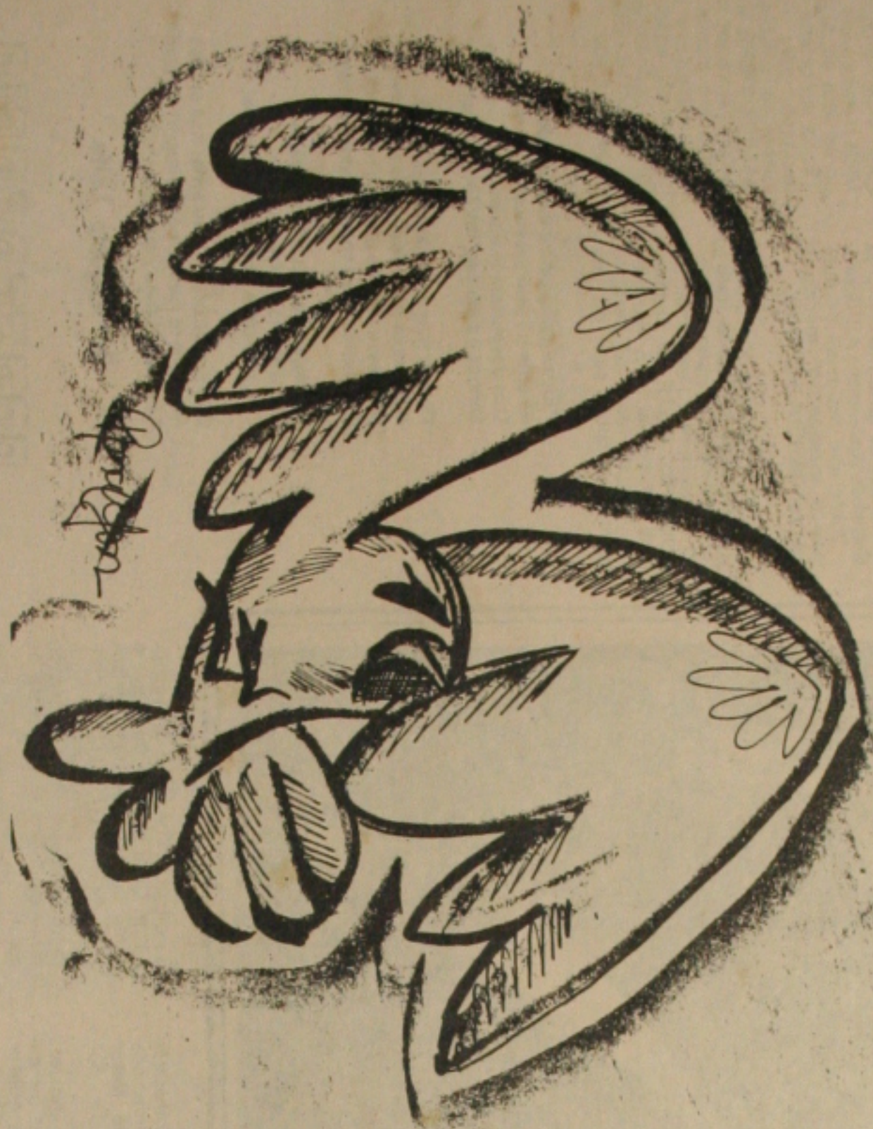
Desenho sergipiano RONALDSON