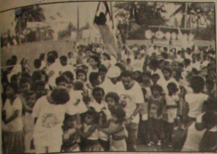
Um domingo de lazer aconteceu em Aracaju, promovido pelo Comitê Feminino.