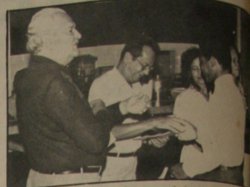
SENAC entrega certificados a concluintes.