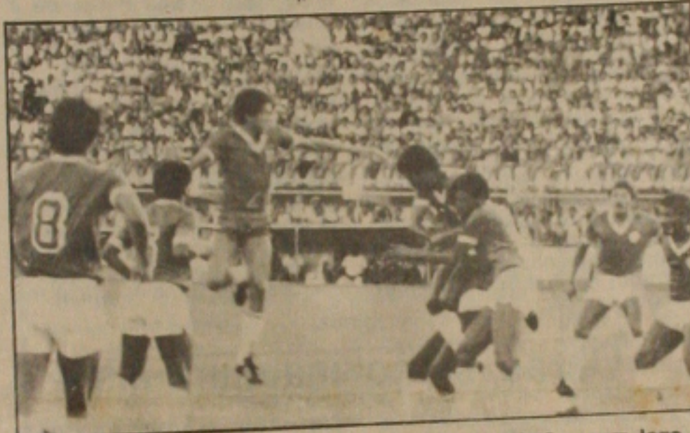
O Sergipe venceu o Confiança domingo no Batistão, num jogo bastante dinâmico.

O Sergipe é líder isolado do super turno que vai indicar o campeão sergipano de 86. Domingo ao vencer o Confiança por 1x0, o time rubro assumiu essa condição e agora vai para a segunda fase com oito pontos ganhos, seguido de perto pelo próprio Confiança que tem seis pontos. O jogo de domingo apresentou um bom nível técnico e a torcida presente ao Batistão, proporcionou uma arrecadação recorde em jogos do campeonato sergipano. A segunda fase começa no próximo domingo com dois jogos. O Sergipe no Batistão recebe a visita do Itabaiana e o Confiança vai até Estância en-