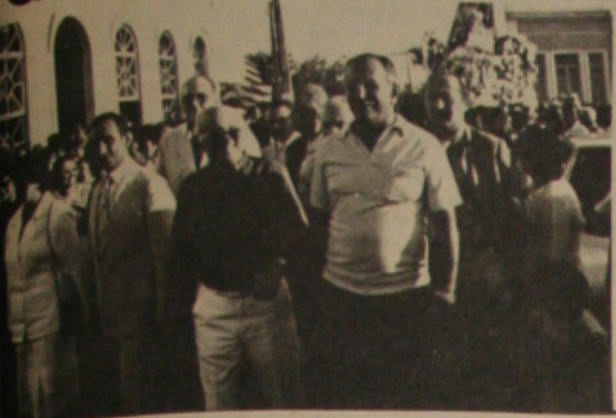
José Carlos Teixeira e Hélio Dantas, são recebidos em Simão Dias.

Deputado José Carlos Teixeira, candidato do PMDB ao governo do Estado, participou de uma procissão de Nossa Senhora Santana, em Simão Dias, onde fez um pronunciamento para centenas de pessoas em que defendeu-se de acusações de seus adversários políticos, lembrando que tanto estava na oposição, quanto de Tancredo Neves e