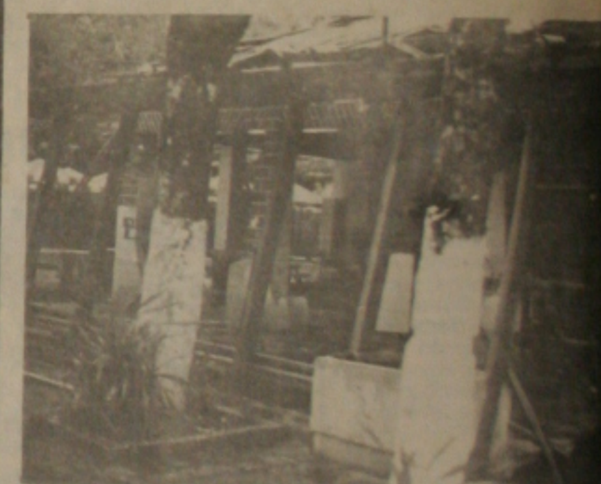
ABERRAÇÃO NO "CACIQUE CHÁ"

mando enormes poças, tornando uma enorme lama. A situação está infernal para a vida dos moradores da rua que, através de inúmeras telefonemas à redação da ZETA DE SERGIPE, solicitaram a presença da reportagem da coluna SOS ARACAJU. A lua, aliás, que foi criada juntamente com esta finalidade de atender aos reclamos de uma população aflita com os desmandos de uma administração municipal que é mais preocupada em se promover do que em solucionar os problemas.