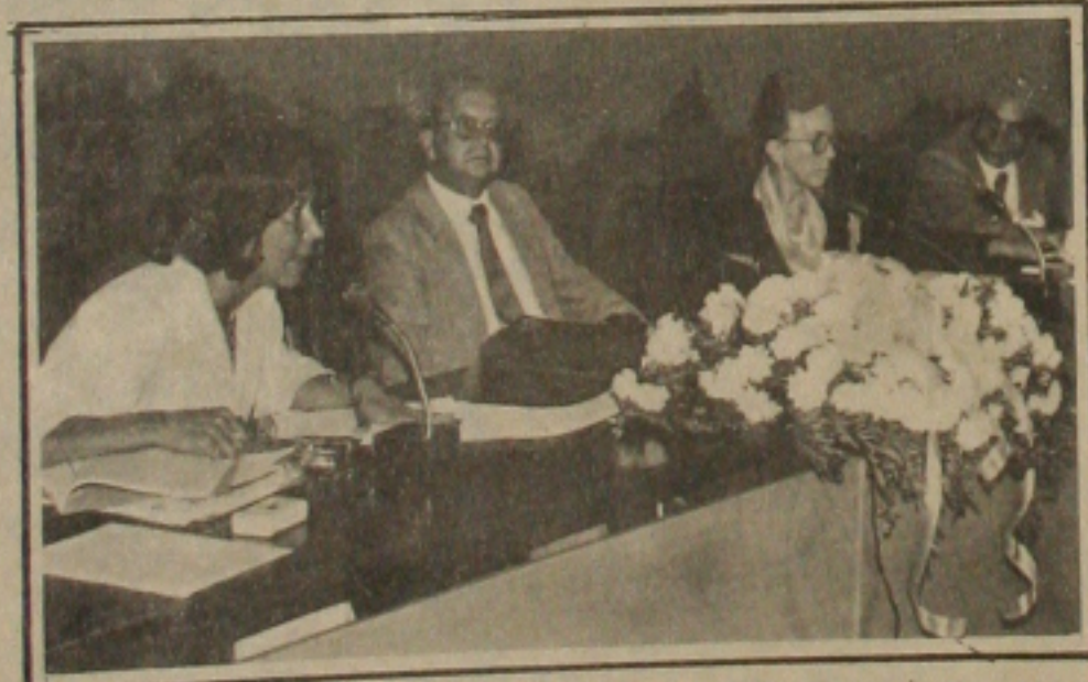
Aspecto da mesa diretora dos Trabalhos no segundo dia de realização do III Encontro Regional de Tropicologia.

o III Encontro Regional de Tropicologia prossegue hoje no auditório do Tribunal de Justiça com a palestra da política e jor-