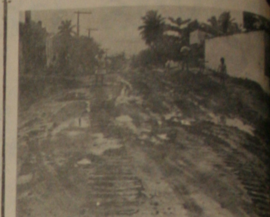
A SITUAÇÃO DA RUA GARARU

A propaganda oficial da Prefeitura de Aracaju, recentemente fez o maior estardalhaço divulgando as "obras" realizadas pela administração Jackson Barreto. Entre essas era citada a rua GARARU. Dizia o informe televisivo que aquela artéria teria sido pavimentada, quando a foto acima mostra exatamente o contrário. Este é o trecho entre a rua Estância e avenida Desembargador Maynard, próximo ao Hospital de Cirurgia. Ontem, com as chuvas que desabaram insistentemente, sobre a cidade, a rua estava praticamente intransitável. Um lamaçal for-