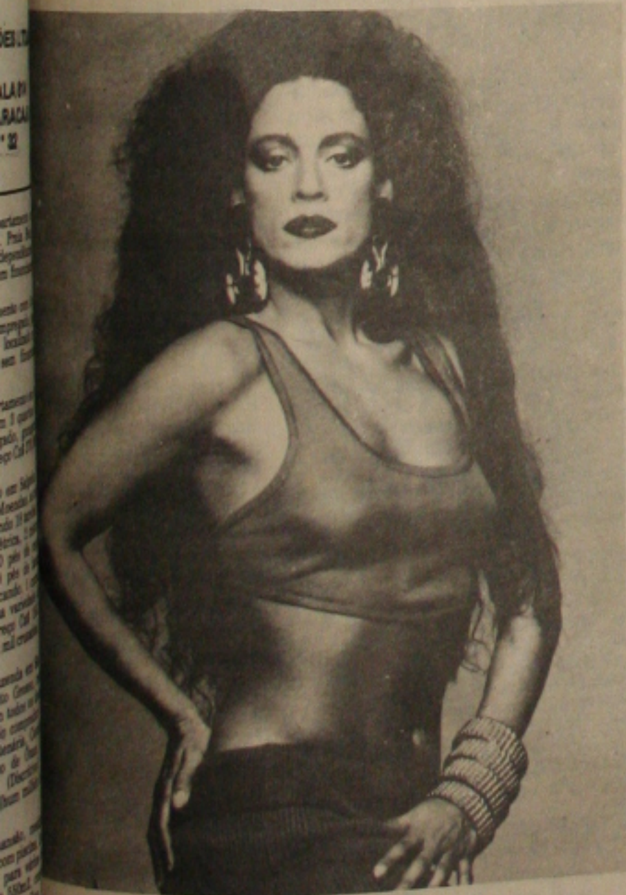
BRAGA, na capa da Revista NOVA.

... musa sensual brasileira (e Exterior também), Sônia Braga na capa da próxima edição da revista Nova, devidamente fotografada por José Antonio: na foto, aparece com seus cabelos soltos (chegando até a cintura), brincos grandes como manda a nova moda, e quatro pulseiras largas ao mesmo tempo e uma minibiúsa que mostra seu umbigo (na hora da foto, a atriz ainda tratou de tirar um pouco mais a cintura para a foto). A foto deixa transparecer a atriz, curvilínea como sem-