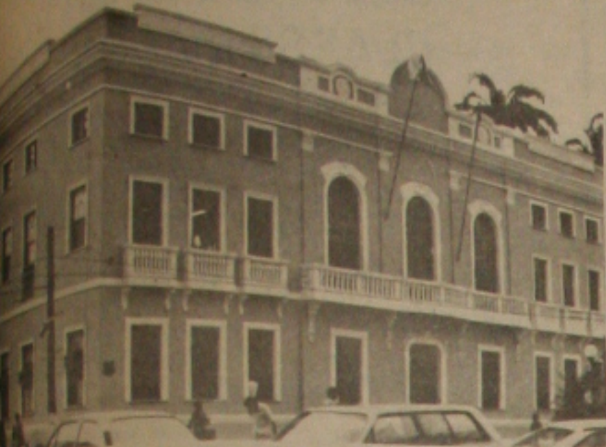
Este prédio de fachada senhoria, atualmente a Assembléia