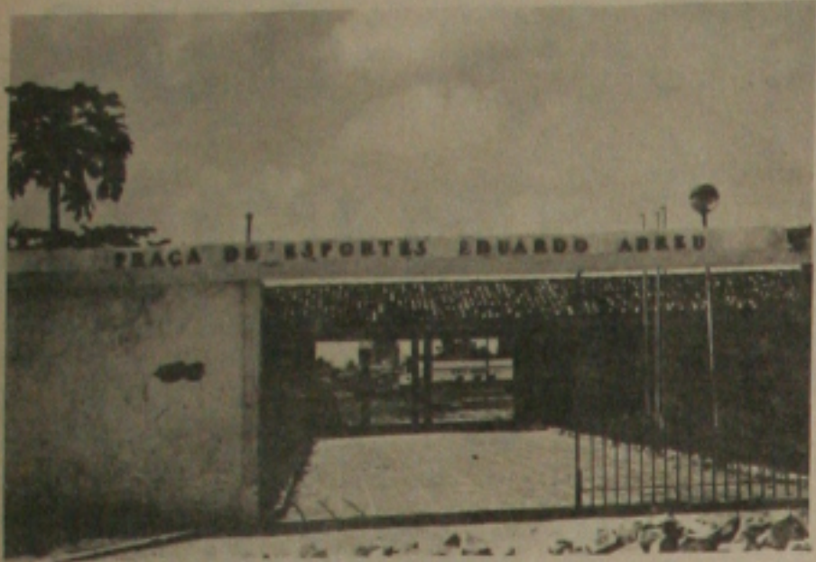
ABANDONO DO CENTRO EDUARDO ABREU