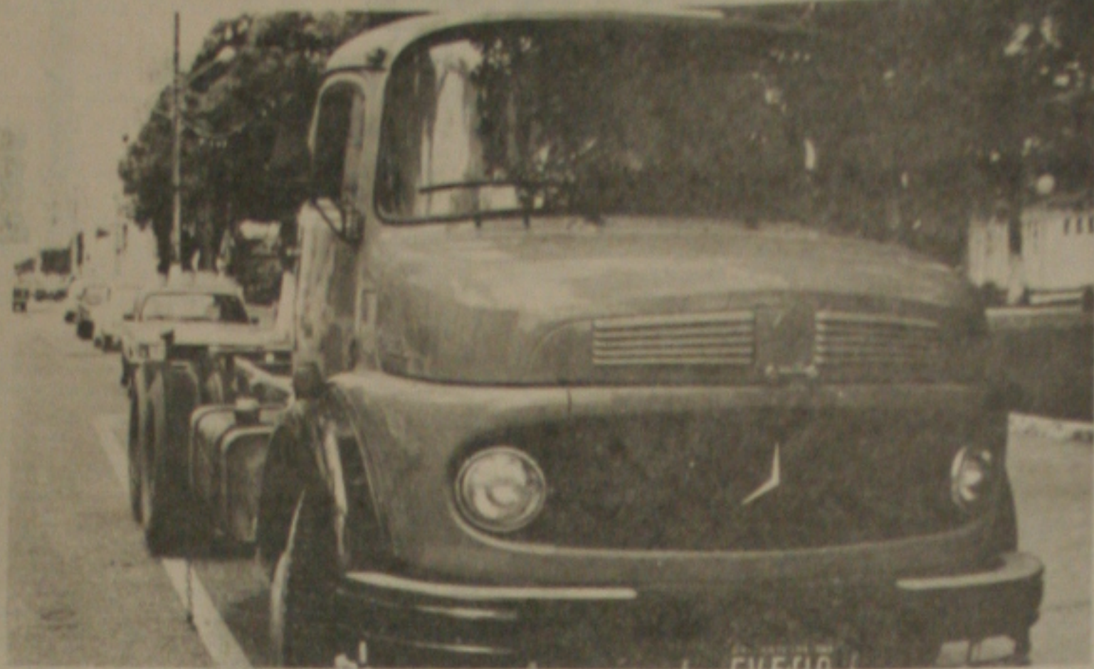
Caminhão roubado é apreendido em Feira Nova

Com a apreensão do caminhão surgiram novas informações sobre carros roubados circulando em Aracaju, sendo descoberto o "Yoyage" modelo 85, cor cinza, de placa fria VY-1059/Vitória da