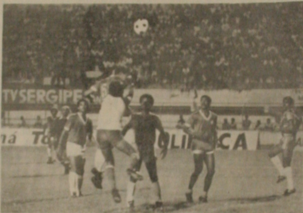
Estanciano quer vencer na despedida.

O Estanciano marca esta noite sua despedida do certame de 86 e pretende com isso fazer de maneira bonita, conseguindo uma vitória sobre o Sergipe. O time ao contrário de domingo poderá contar com todos os titulares, principalmente aqueles que não enfrentaram o Itabaiana. Pingueta fez um treino coletivo ontem à tarde e logo após definiu a equipe.