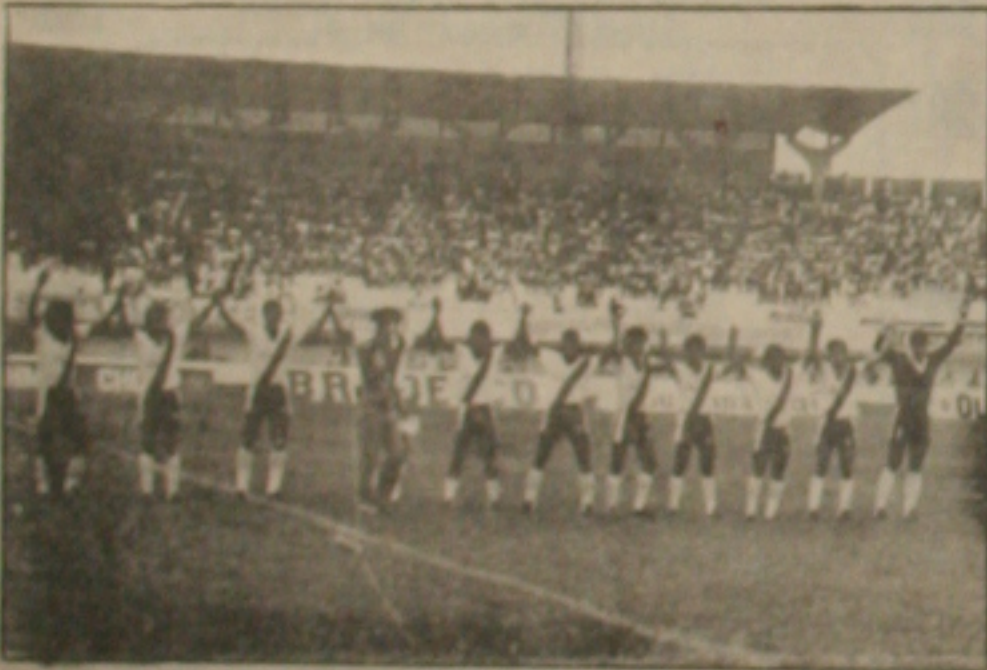
Vasco terá modificação na equipe domingo.

O Vasco iniciou ontem pela manhã os trabalhos visando o jogo de domingo contra o Sergipe, que para os vascaínos é muito importante. Uma vitória deixará o Vasco na liderança do super turno e muito bem próximo do título, faltando apenas uma partida contra o Itabaiana, no Presidente Médici. Nessa partida, Cacau mais uma vez, não poderá contar com o time completo. Três titulares terão de cumprir suspensão automática por motivos de cartões amarelos, ou vermelho.