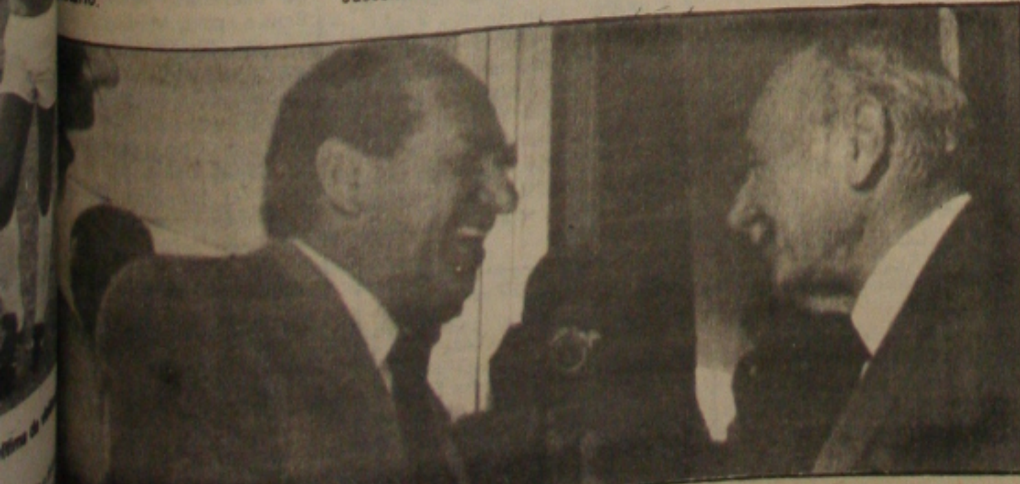
Senador José Fragelli cumprimenta o presidente do Uruguai, Julio Maria Sanguinetti, durante sua visita ao Congresso Nacional

Quem adquiriu algum veículo e deixou passar este prazo pode regularizar sua situação até o dia 22 de agosto sem qualquer acréscimo referente a juros de mora (1 por cento ao mês. A partir do dia 22 de agosto passa, efetivamente, a vigorar o prazo de apenas cinco dias para o recolhimento do Compulsório.