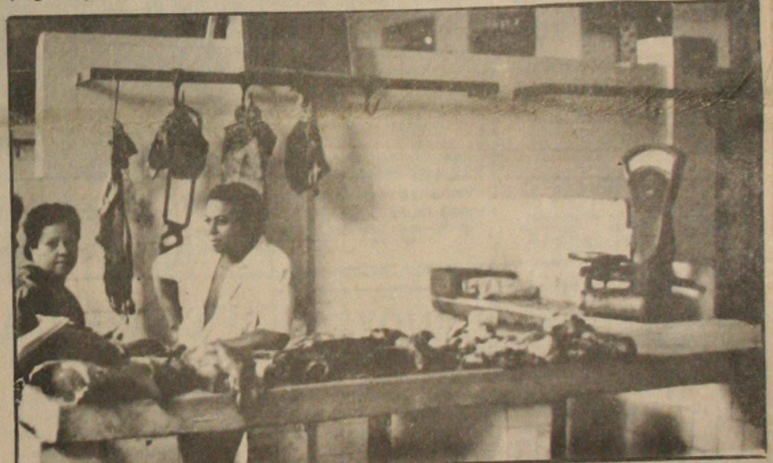
Os açougues foram fiscalizados, e alguns marchantes punidos.

Depois, retornou ao salão, percorreu a sala de armas do Palácio do Buriti e confraternizou com os 120 convidados do Governador para o almoço, servido em seguida.