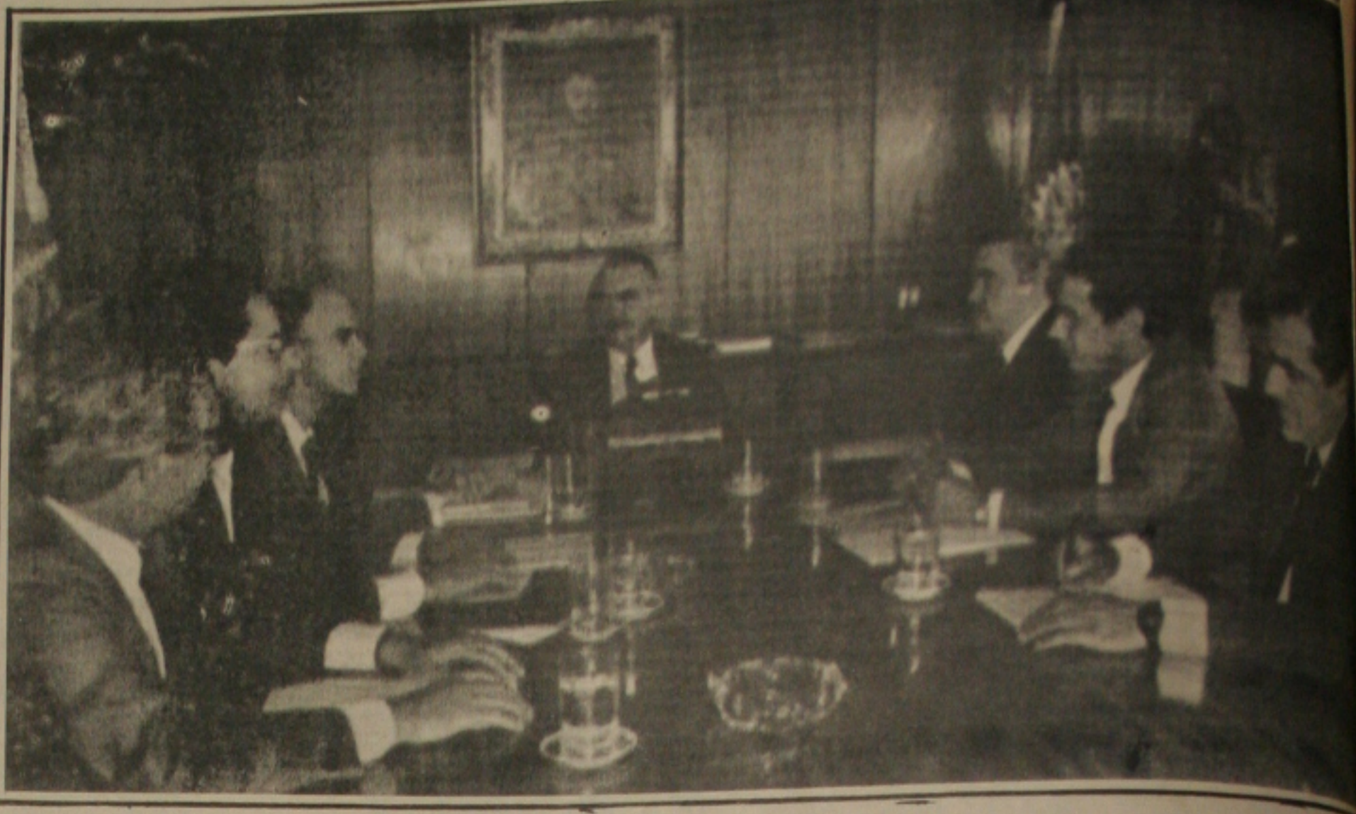
O Presidente José Sarney preside reunião do Conselho Político.

A iniciativa do governo no campo da agricultura que serão anunciados depois de amanhã pelo Presidente