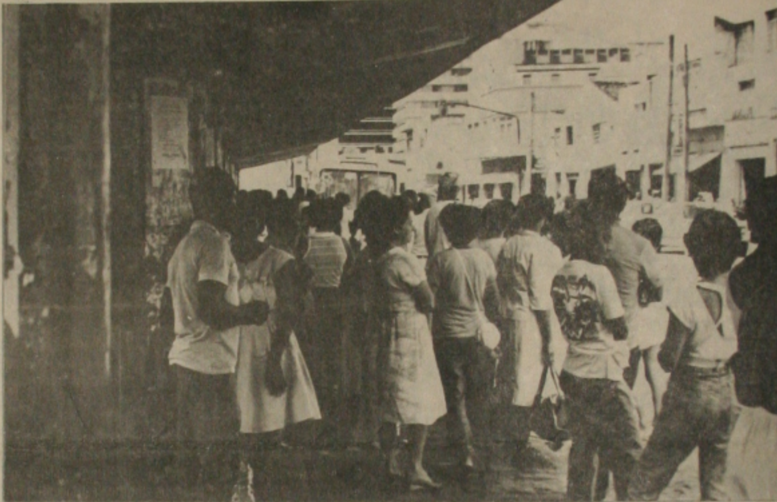
Os usuários reclamam do novo itinerário dos transportes coletivos.

Este o papel da imprensa sadia e que visa atender sobretudo aos reclamos da população. Este é sobretudo, o papel deste matutino.