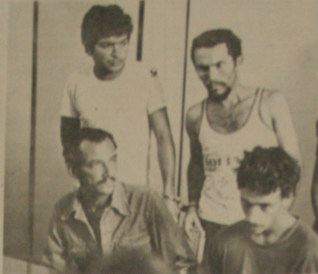
Parte da "gang" de traficante que terá que prestar contas à Polícia Federal de seus atos ilícitos.