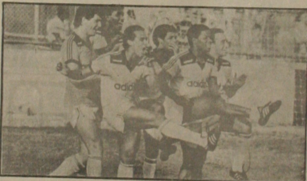
Flamengo pega o Sergipe no Maracanã

A Tabela da Copa Brasil Divisão especial finalmente foi divulgada oficialmente ontem pela CBF. Para os sergipanos a grande surpresa: o Sergipe que esperava enfrentar Flamengo e Corinthians no Batistão, com perspectivas de boas arcações e um melhor resultado técnico, vai ter que enfrentar essas duas equipes fora de casa, ou seja no Maracanã e Pacaembu respectivamente. Torcedores sergipanos ouvidos ontem à noite pela Gazeta de Sergipe se declararam decepcionados com a atitude da CBF e alguns culpados o presidente Manoel Cardoso que não exerceu qualquer influência para beneficiar um seu filho.