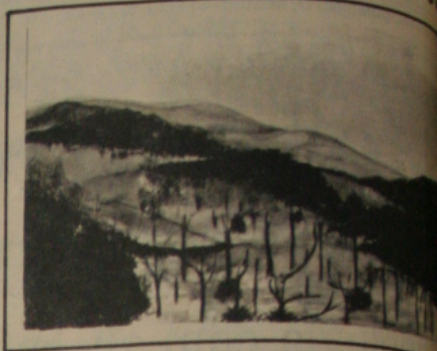
Paisagem rural de Plínio Rigon.

No próximo dia 22, a Ludus Artis Galeria estará abrindo suas portas a partir das 20:30 horas, para o vernissage do Artista Plástico Plínio Rigon. A mostra constará de 30 trabalhos, sendo 10 acrílicas e 20 aquarelas, tendo a paisagem rural, como tema.