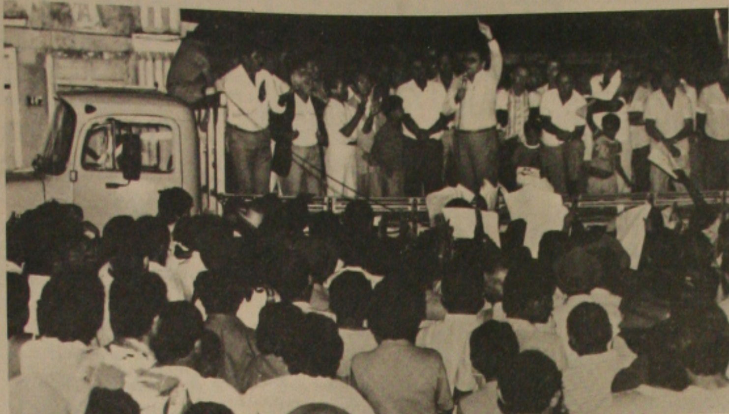
Centenas de pessoas no comício peemedebista em Campo do Brito.