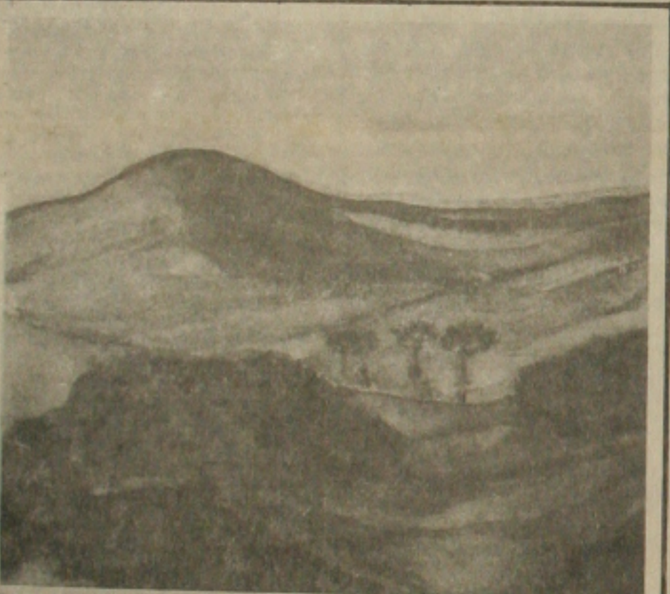
Este é um dos trabalhos do artista Plínio Rigon.

Será hoje às 20:30 horas, na Ludus Artis Galeria, a abertura da exposição de pinturas do artista plástico Plínio Rigon. A mostra reunirá 30 quadros, enfocando a paisagem rural, sendo 20 aquarelas e 10 acrílicas sobre placa.