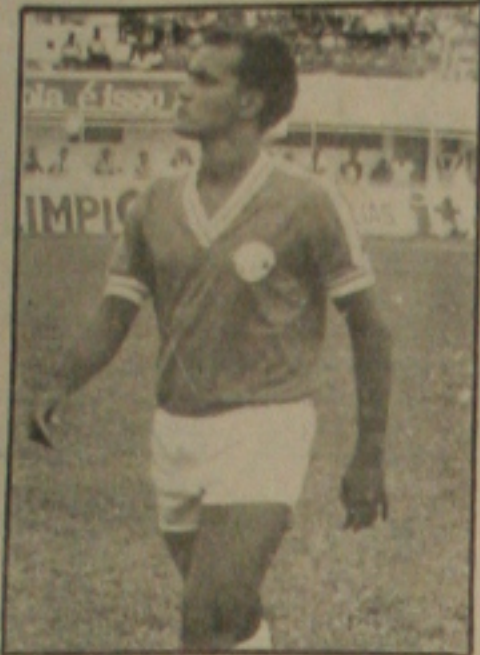
Junior pode ocupar vaga de Marquinhos

O fato de poder deixar o campo domingo com o título assegurado está motivando o elenco. Mas o treinador Duque muito experiente admite que o Confiança vai jogar de acordo com o regulamento e a vitória é muito difícil, pois ele conhece bem o adversário. O treinador não quer no entanto ser surpreendido como foi na partida do primeiro turno. O Confiança terá todas as precauções necessárias e vai lutar pela vitória. "Mas não será na base do desespero abrindo espaços para o adversário. Quem tem que lutar