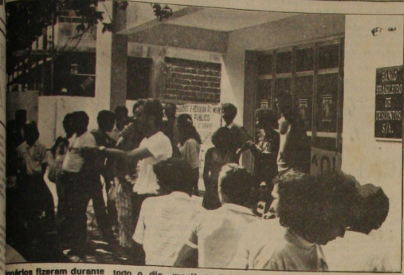
Funcionários fizeram durante todo o dia, manifestações em frente as agências do Bradesco.