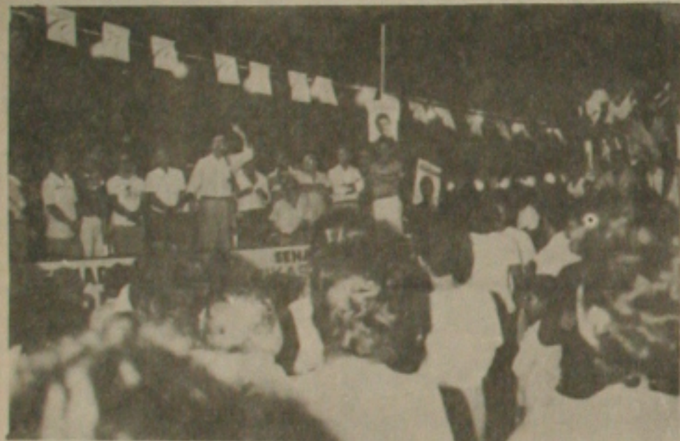
Multidão participa dos comícios da Coligação Peemedebista.

Ontem, como foi o dia do folclore, diversos grupos folclóricos sergipanos, fizeram apresentações na Rua João de Deus. O que mais sucesso teve, foi o "Parafuso". Momentos em que dos compunham o grupo imitavam uma tainzeira.