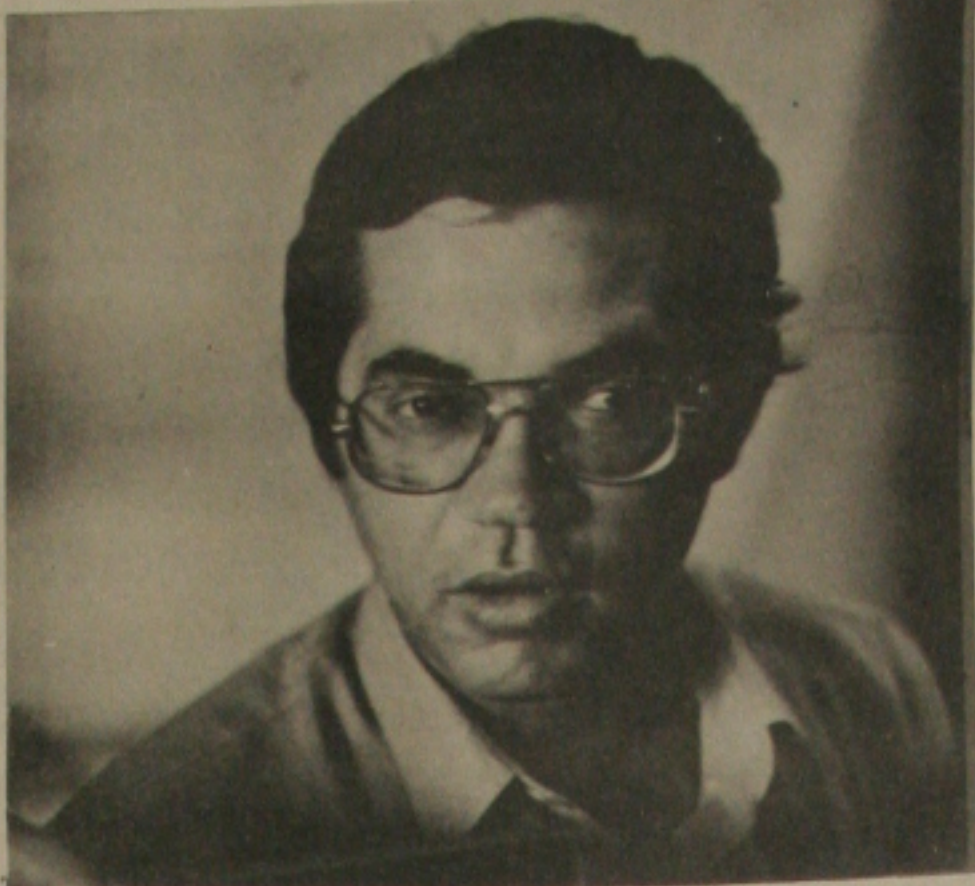
Nilton Vieira defende união das classes políticas...

A candidata do PT ao Governo do Estado, professora Tânia Elias Magno e comitiva estará durante todo o dia de hoje no município de Itaporanga D'Ajuda, onde deverá manter contatos com a população, simpáticos e adeptos do partido naquele município. Tânia aproveitará para percorrer todos os povoados de Itaporanga D'Ajuda, regressando no final da tarde à Aracaju.