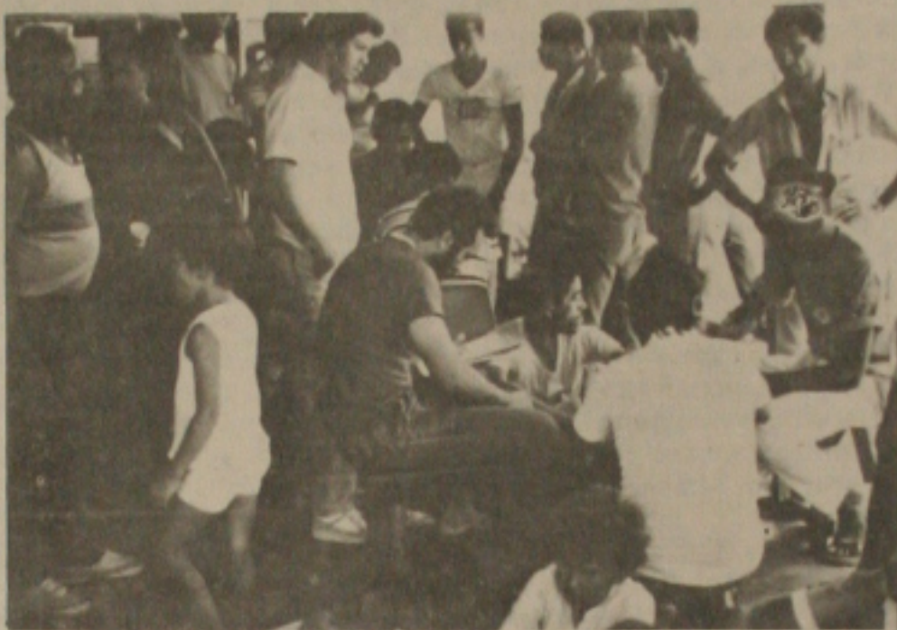
Os operários continuam scampados e a greve poderá prosseguir por tempo indeterminado.

que está muito claro, é que a Petromisa tenta forjar uma maneira de envolver as forças do Estado para acirrar mais o impasse por ela provocado, inclusive com o uso de violência.