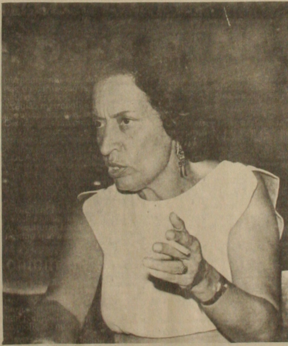
A Economista Maria Conceição Tavares

BRASILIA, (EBN) - O Plano Cruzado "já deu certo e quem pergunta sobre sua eficácia, na economia brasileira, está apenas fazendo uma pergunta ingênua", declarou ontem a professora Maria da Conceição Tavares, assessora da Secretaria do Planejamento da Presidência da República, destacando que "esta suposta falta de mercado", que acontece em algumas cidades, "não passa da escassez provocada por algumas empresas, que estão pressionando o Conselho Interministerial de Preços (CIP), para que seus produtos sejam reclassificados". Ela garantiu, porém, que "isso não vai acontecer sob hipótese alguma".